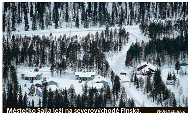
Městečko Salla leží na severovýchodě Finska.

„Naše léta jsou čím dál teplejší a naše zimy jsou čím dál kratší. Potřebujeme, aby Sal-