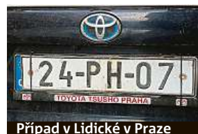
Případ v Lidické v Praze

pro vjezd do lesů Arcibiskupství pražského. „Dotyčný není naším zaměstnancem, toto povolení platilo omezeně pro rok 2015 a jen do lesa v oblasti Týn nad Vltavou,“ uvedl pro deník Metro mluvčí arcibiskupství Jiří Prinz.