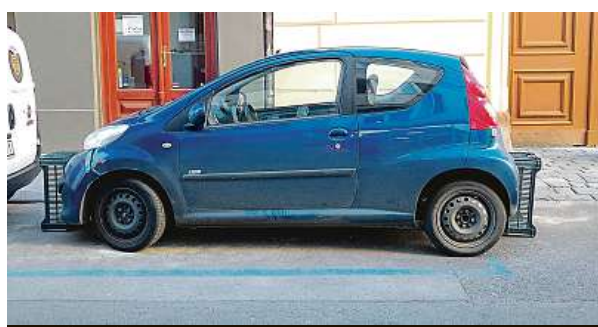
Méně využívané zakrytí bedýnkami

Nedávno upozornil čtenář deníku Metro na parkující auto v pražské Lidické ulici. Mělo přes registrační značku přichycenou starou, již neplatnou „espézetku“ od převážného vozíku. Za předním sklem bylo dokonce povolení