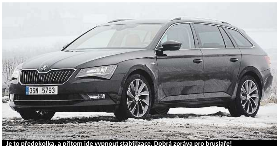
Je to předokolka, a přitom jde vypnout stabilizace. Dobrá zpráva pro bruslaře!