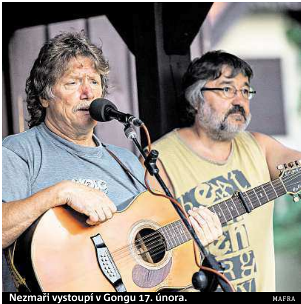
Nezmaři vystoupí v Gongu 17. února.

V únoru se představí v Divadle Gong dnes již folkové legendy. Gong se však zaměřuje také na malé.