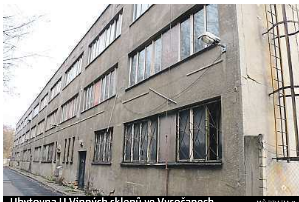
Ubytovna U Vinných sklepů ve Vysočanech

Ještě v roce 2013 fungoval objekt jako běžná ubytovna,