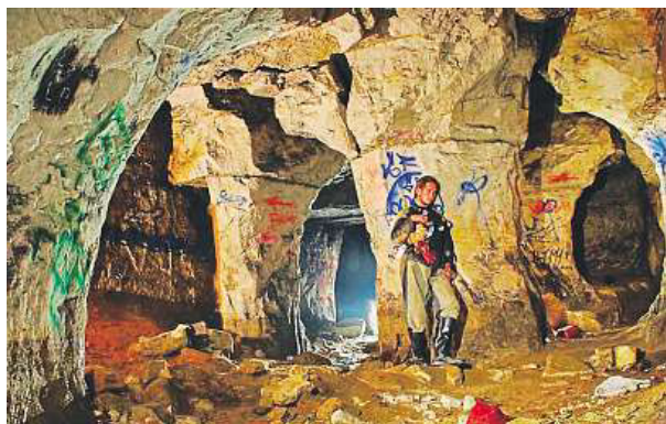
Prosecké podzemí stále čeká na své zpřístupnění. MČ PRAHA 9

Největší témata devítky podle starosty Jana Jarolíma.