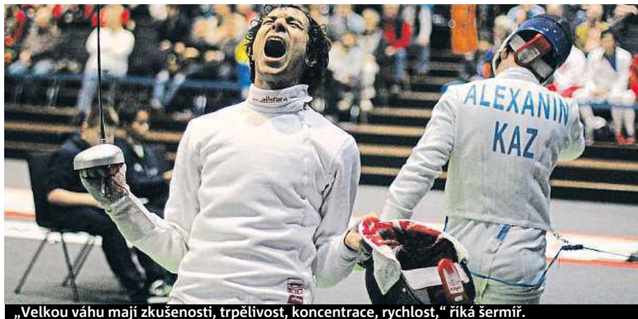
„Velkou váhu mají zkušenosti, trpělivost, koncentrace, rychlost,“ říká šermíř.