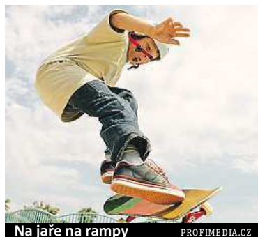
Na jaře na rampy

Už na jaře tak budou moci místní děti využít dvě velké rampy a řadu dalších herních prvků. „K nápadu postavit skatepark nás přivedl fakt, že v Praze 9 chybí sportovní vyžití pro starší děti. Krásných dětských hřišť pro ty nejmenší máme už dostatek. Teenageři však mají jen hřiště u základních škol a to nestačí. Potřebují alternativní sportovní prostory. Donedávna jsme měli malý skatepark u ZŠ Litvínovská, který však už nevyhovoval a navíc zde děti rušily ostatní sportov-