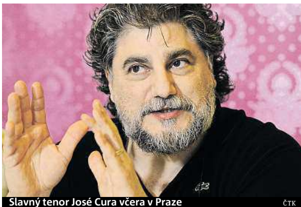
Slavný tenor José Cura včera v Praze