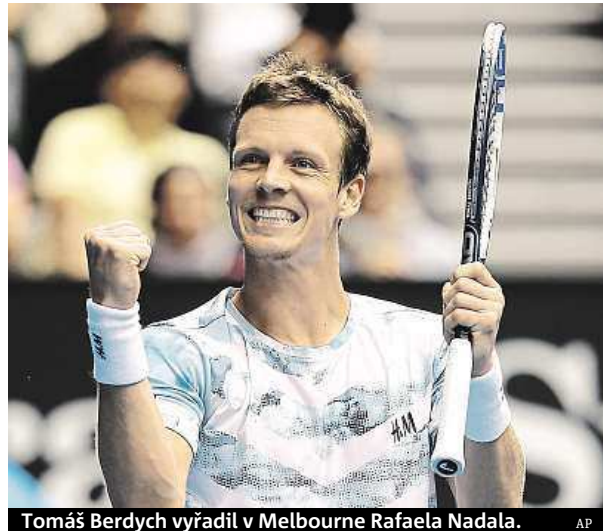
Tomáš Berdych vyřadil v Melbourne Rafaela Nadala.