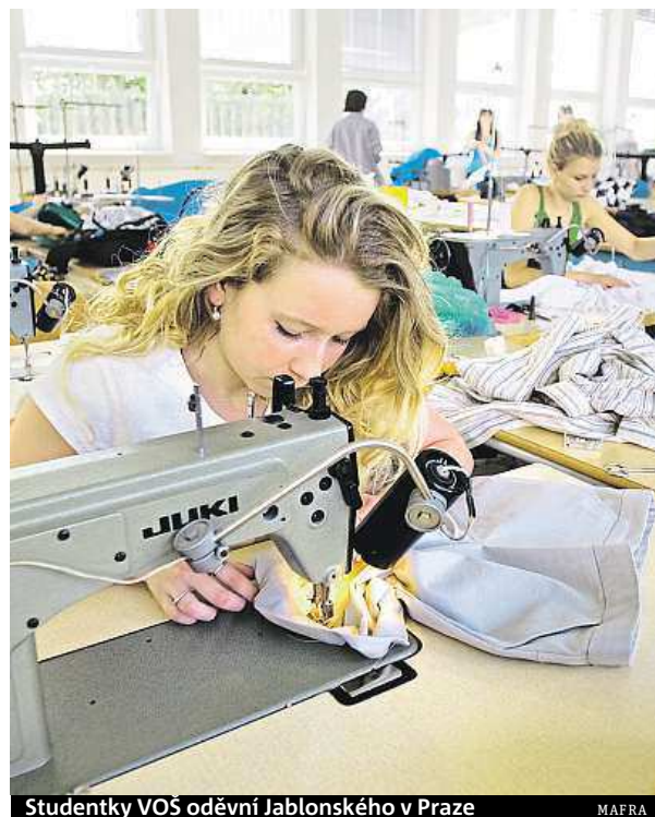
Studentky VOŠ oděvní Jablonského v Praze