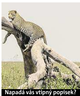
Napadá vás vtipný popisek?

Napište bublinu a reagujte na sloupek na: www.facebook.com/denikmetro