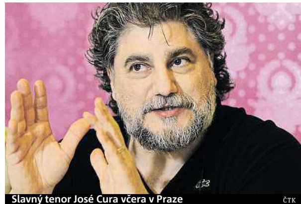
Slavný tenor José Cura včera v Praze