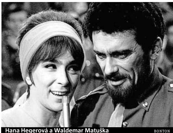
Hana Hegerová a Waldemar Matuška

Autorem námětu a původního pásma byl Jiří Suchý, podle kterého měl film v době své premiéry trochu smůlu. Byl totiž černobílý a čelil barevnému muzikálu Starci na chmelu, který měl premiéru pouhé