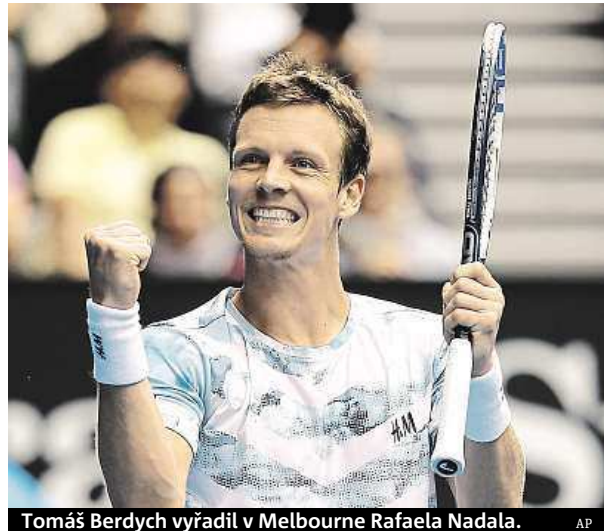
Tomáš Berdych vyřadil v Melbourne Rafaela Nadala.