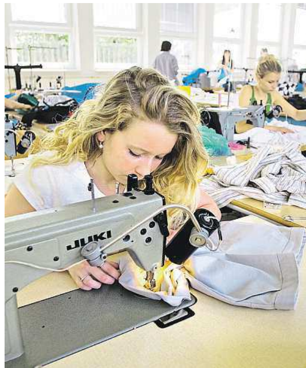
Studentky VOŠ oděvní Jablonského v Praze