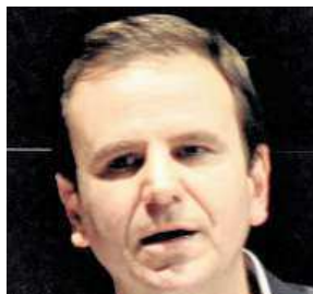
Starosta Eduardo Paes čov

Poukazuje například na vývoj v infrastruktuře: „V roce 2010 mělo přístup k hromadné dopravě jen osmnáct procent obyvatel. Po olympiádě to bude přes šedesát procent populace.“ Rozpočet na pořádání OH se pohybuje okolo