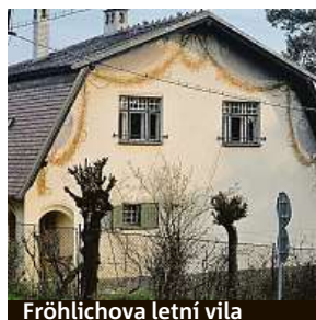
Fröhlichova letní vila