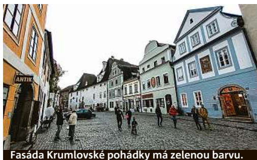
Fasáda Krumlovské pohádky má zelenou barvu.