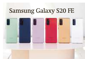
Samsung Galaxy S20 FE

Udělejte radost sobě nebo vašim blízkým novým telefonem Samsung z vrcholné modelové řady S. Telefon můžete ve speciální nabídce pořídit až do konce