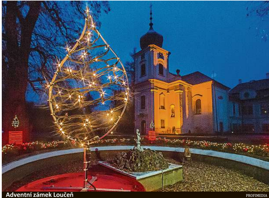
Adventní zámek Loučeň

Návštěvníci se mohou těšit na celkem 22 různě nazdobených vánočních stroměčků, přičemž každý z nich vypráví svůj jedinečný kouzelný příběh. Hlavním tématem letošní výstavy je „Věhlas českého průmyslu první republiky“