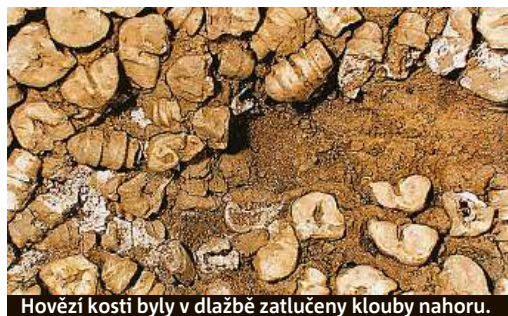
Hovězí kosti byly v dlažbě zatlučeny klouby nahoru.