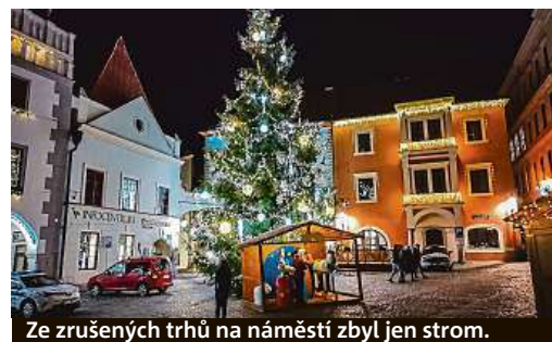
Ze zrušených trhů na náměstí zbyl jen strom.