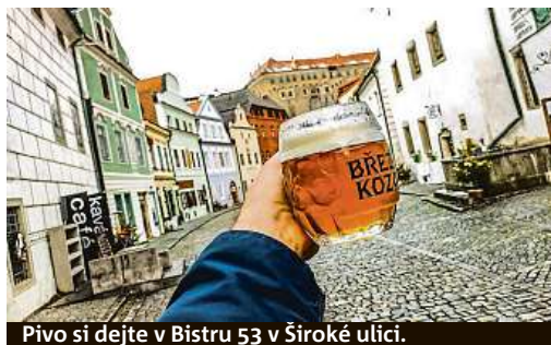
Pivo si dejte v Bistru 53 v Široké ulici.