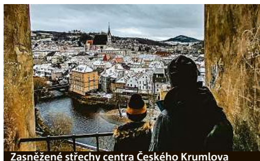
Zasněžené střechy centra Českého Krumlova