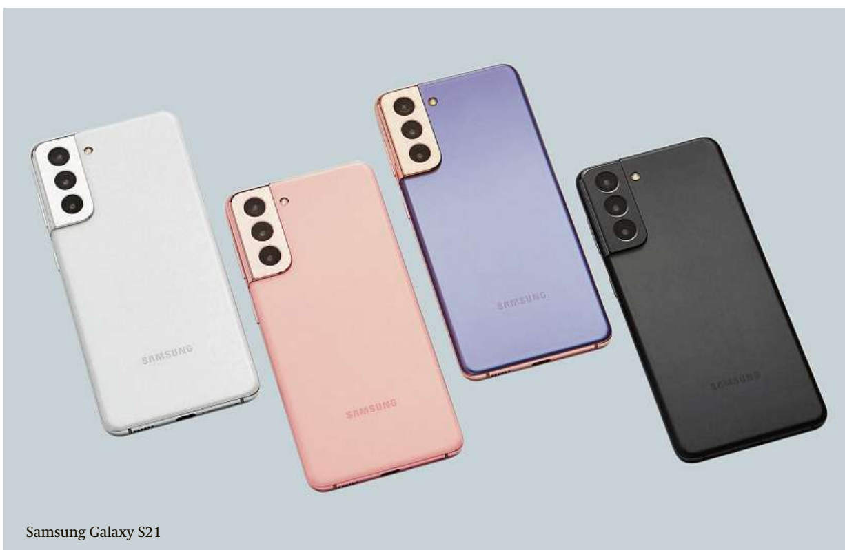
Samsung Galaxy S21

Samsung spustil prosincový výprodej svých vlajkových lodí a nabízí vybrané modely řady Galaxy S21 a Galaxy S20 FE 5G až o 6500 Kč levněji. Akce platí do 31. prosince 2021 nebo do vyprodání zásob na e-shopu samsung.cz , ve značkových prodejnách Samsung a u vybraných prodejců elektroniky.