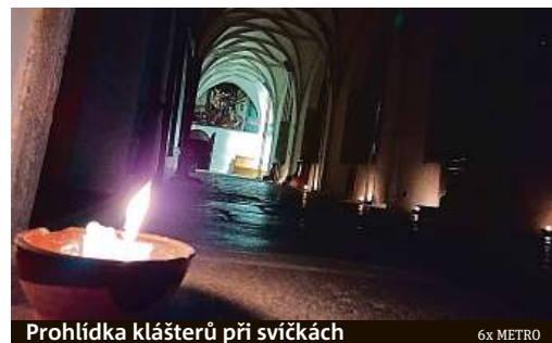
Prohlídka klášterů při svíčkách