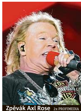
Zpěvák Axl Rose

K nejnavštěvovanějším událostem roku, jež si vychutnávají desítky tisíc lidí, by se měly zařadit open air akce v pražských Letňanech. V neděli a v pondělí 15. a 16. května tam strhnou pódium Rammstein a hned krátce po nich, 18. května, se dostane na legendární americké