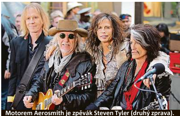
Motorem Aerosmith je zpěvák Steven Tyler (druhý zprava).

Trochu oddechu metropoli dopřeje v únoru popový zpěvák Enrique Iglesias, O2 arenu bude chtít dojmout v pátek 18. února. Tutéž arenu v sobotu 12. března rozbourá švédská metalová parta Sabaton.