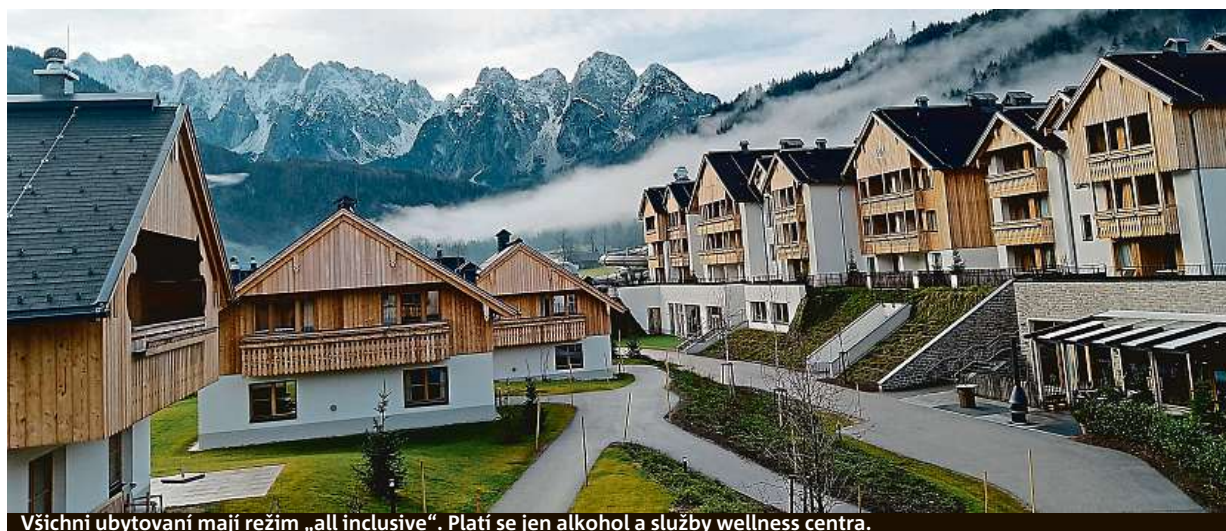
Všichni ubytovaní mají režim „all inclusive“. Platí se jen alkohol a služby wellness centra.

Zaměřuje se na vysokou kvalitu v oblasti prodeje, servisních služeb, v dodání náhradních dílů a příslušenství.