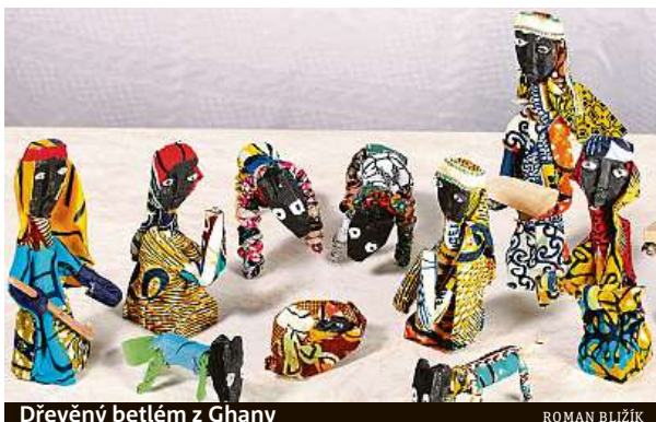
Dřevěný betlém z Ghany

Některé se od těch našich výrazně neliší. U jiných ale