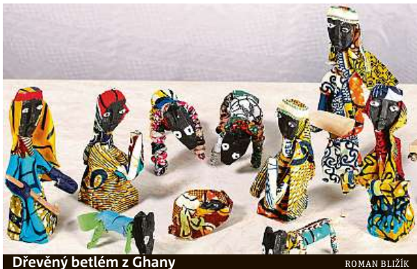
Dřevěný betlém z Ghany

Některé se od těch našich výrazně neliší. U jiných ale