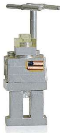
Kolem roku 1974 2x LEGO