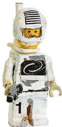
Kosmonaut z roku 1978

Minifigurka Lego si zahrála v několika hollywoodských hitech včetně Lego příběhu, Lego Batman filmu a Lego Ninjago filmu. Společnost Lego Group také vytvořila deset tisíc pochromovaných zlatých minifigurek C-3PO a přibalila je do náhodných stavebnic, aby oslavila třicáté narozeniny Hvězdných válek. METRO