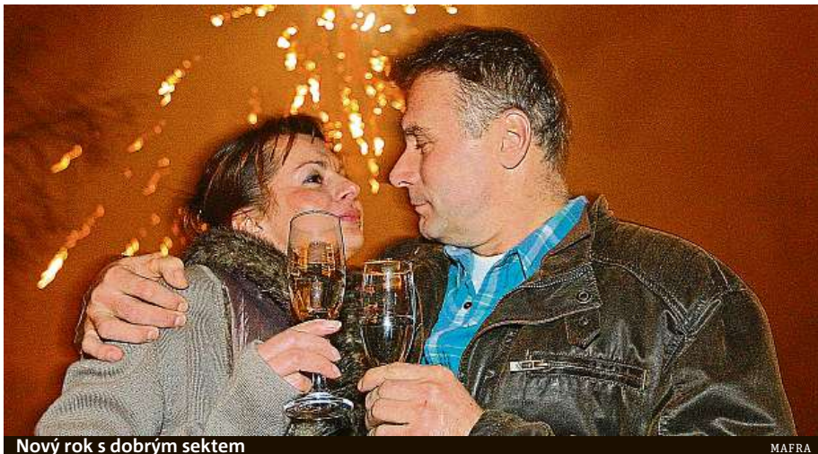
Nový rok s dobrým sektem

„Ke klasickým polévkám bych určitě doporučil vína odrůd Veltlínské zelené nebo Ryzlink vlašský, ke smaženým pokrmům si vždy rád dám elegantní sekt postavený na odrůdách Rulandské bílé, Ryzlink rýnský nebo Ryzlink vlašský. Jeho kyselinka