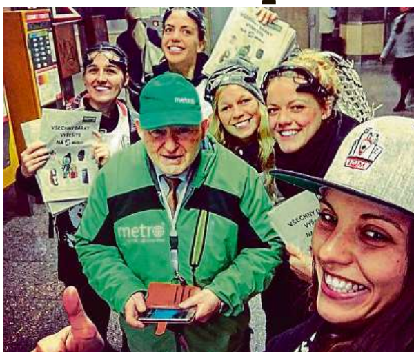
Hráčky lakrosu rozdávaly Metro.