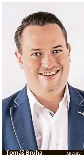
Tomáš Brůha ARCHIV