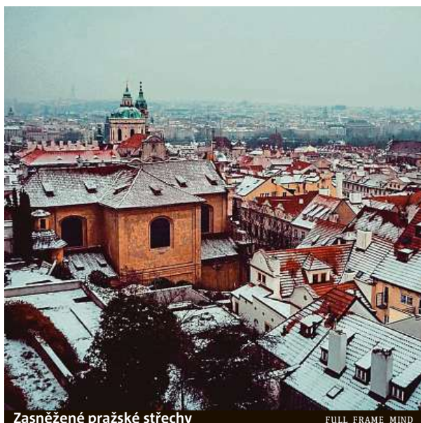
Zasněžené pražské střechy