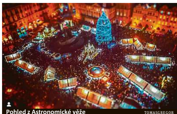
Pohled z Astronomické věže