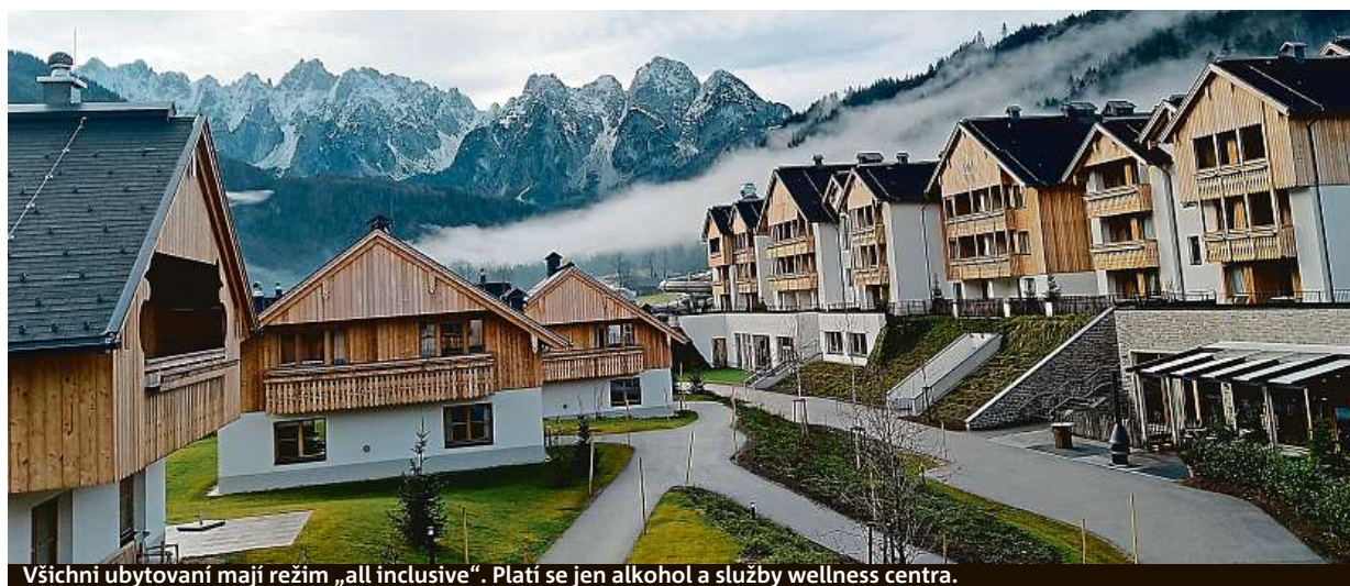
Všichni ubytovaní mají režim „all inclusive“. Platí se jen alkohol a služby wellness centra.

Zaměřuje se na vysokou kvalitu v oblasti prodeje, servisních služeb, v dodání náhradních dílů a příslušenství.