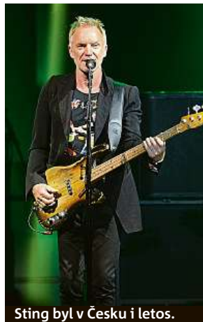
Sting byl v Česku i letos.

Legendární kapely, věční návštěvníci Česka či domácí kulaté oslavy. Deník Metro rozdělil záplavu koncertů do pěti sekcí od písmene N.