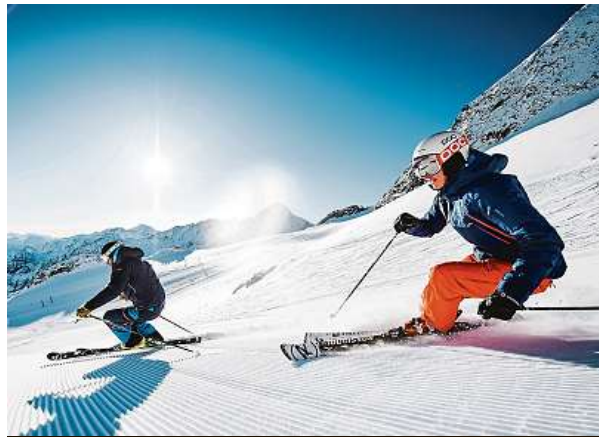
Na Stubai si užijete perfektní sjezdovky.

Jak již bylo nastíněno, kromě vychutnávání si zdejší přírody pod rouškou noci na turistu čeká i doprovodný program, který příjemně dokresluje jedinečnou atmosféru. Turistická trasa osvětlená pochodněmi a lucernami vede poměrně rozsáhlou oblastí a je přizpůsobená i rodinám s dětmi či seniorům. Vyzkoušet si můžete i curling nebo bruslení na místních rybnících. U budovy horské