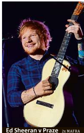
Ed Sheeran v Praze