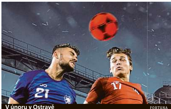
V únoru v Ostravě