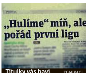
Titulky vás baví.