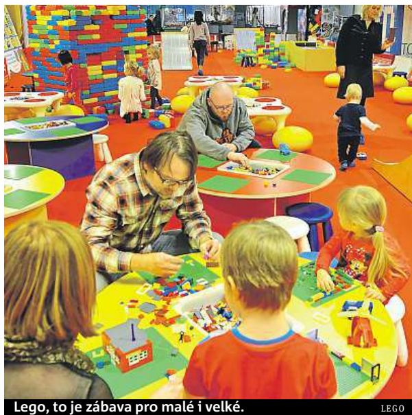
Lego, to je zábava pro malé i velké.