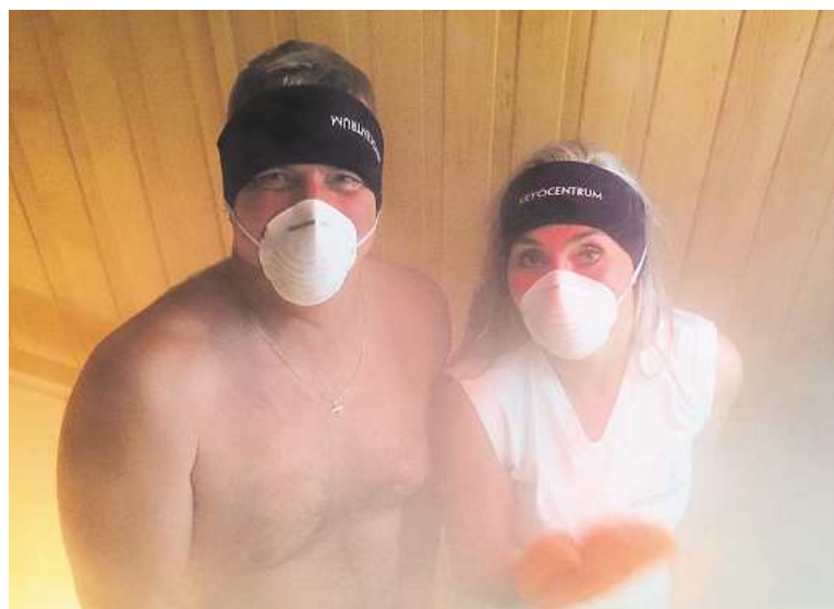
S sebou si na kryoterapii vezměte bavlněné věci či starší plavky.