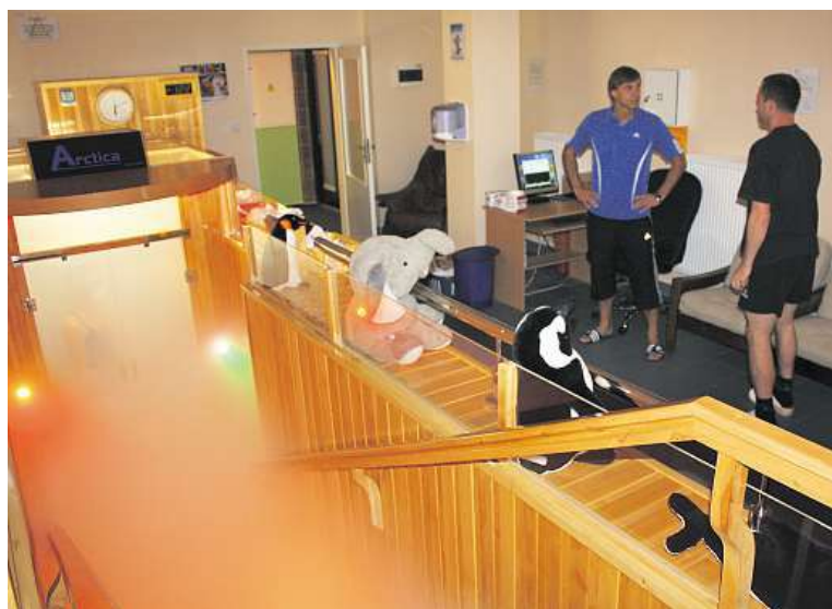
Do polária v Praze 4 se vejdou dvě až tři osoby.