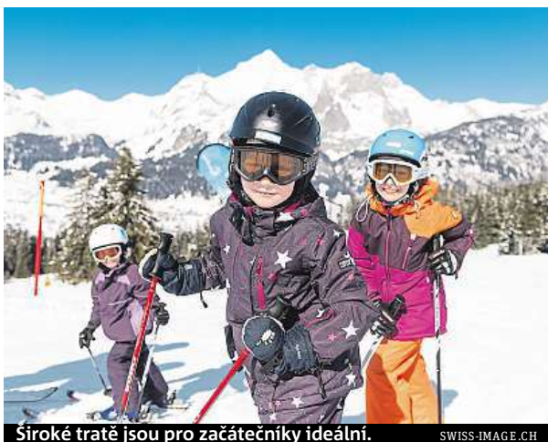
Široké tratě jsou pro začátečníky ideální.

Se skipasem Dolomiti Superski lyžují ve většině jihotyrolských areálů děti do osmi let zdarma v doprovodu rodičů. Vybrat si můžete hned ze dvanácti lyžařských středisek. Vyzkoušet můžete například Seiser Alm s ideálními mírnými terény a s lehkými a středně těžkými sjezdovkami. Nechybí ani slalomy na