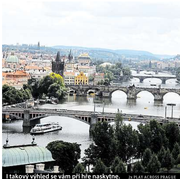
I takový výhled se vám při hře naskytne.

Hru provozujeme celoročně, nicméně v zimě je návštěvnost nižší. Vhodný termín však není problém najít v kteroukoli dobu.