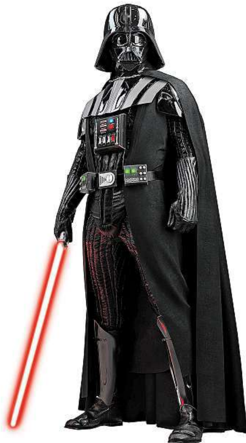
Darth Vader. Kostýmem party nezkažte. DEATHBATTLEFANON