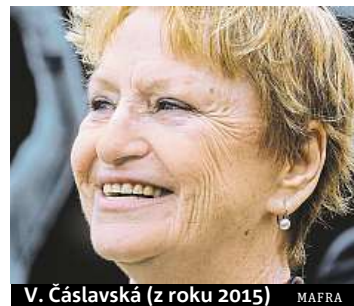
V. Čáslavská (z roku 2015)

ce moderních hudebních klipů), legendární kytarista Radim Hladík (ve věku 69 let) nebo herec Josef Mixa (bylo mu 92 let).