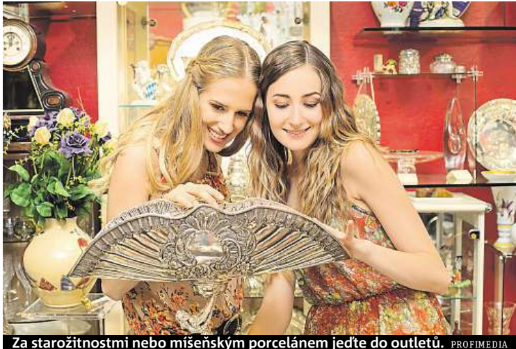
Za starožitnostmi nebo míšeňským porcelánem jedte do outletů.

Oblečení, doplňky či obuv bývají kvalitnější a levnější za hranicemi.