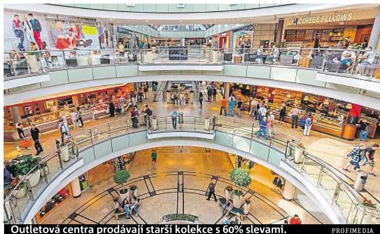
Outletová centra prodávají starší kolekce s 60% slevami.

Opravdovým rájem shopoholiků je outletové centrum Ingolstadt Village kousek za Řeznem. Najdete tu více než tisíc outletových obchodů, které prodávají starší kolekce s 60procentními slevami. (GPS N 48°47'02.6"E 11°28'49.7".) Podobné centrum se nachází také ve Wetheim Village nedaleko Frankfurtu. (GPS N 49°46.49263', E 9°34.58680'.) Pokud máte rádi míšeňský porcelán, vydejte se do outletových center Meissen Couture Outlet v Míšni a v Drážďanech. LUCIE MOTTLOVÁ