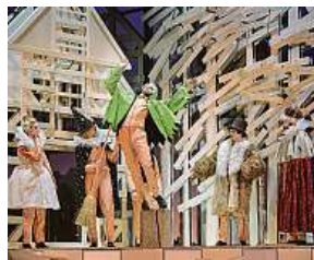
Ukázka z představení LouTkáček

„Ačkoliv zde hudba hraje zásadní roli, není LouTkáček operou v pravém slova smyslu. Dílo má šestnáct uzavřených hudebních čísel, vokálních i čistě instrumentálních, která nejsou dlouhá, a v případě zpívaných částí nejde o klasické operní árie, ale spíše o písňovou formu. Hudba je proscena vánoční tematikou a pro nás je zajímavé, že na úvod zaznívá česká koleda Neseš vám noviny,“ říká dirigent David Švec.