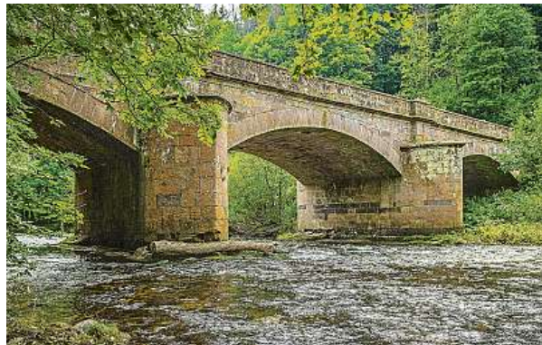
Liberecký kraj chtěl most kvůli špatnému stavu zbourat a nahradit novým. Po nátlaku odborníků a veřejnosti byl zachráněn.

Kamenný obloukový most Na Mejtě je z druhé poloviny 19. století. Původně ho chtěl kraj kvůli špatnému stavu nechat zbourat a nahradit beto-