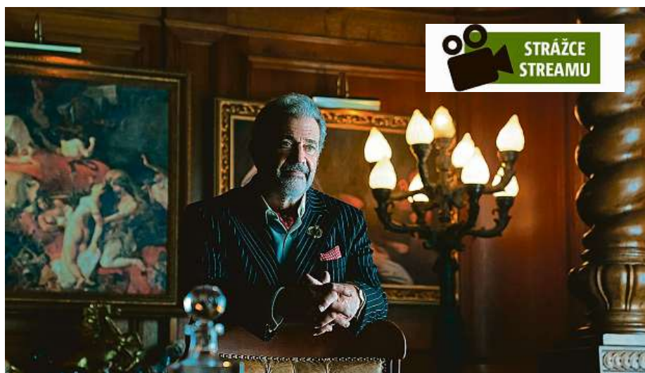
Seriálový prequel o třech epizodách vypráví o mladém Winstonovi. Jakmile ale na scénu vstoupí dábel Mel Gibson, na vše ostatní, zejména pokud jste fanoušci, v mžiku zapomenete.

Ale nejen to. Jeho Cormac krásně balancuje na hraně úlohy do kouta zahnaného manipulátora, kterému jde