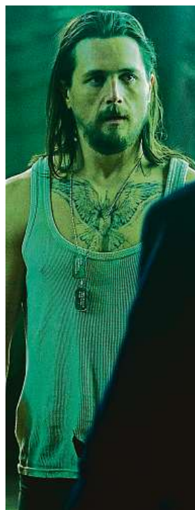
Frankieho v podání Bena „vikinga“ Robsona si užijete.

Hrají: Mel Gibson, Katie McGrathová, Colin Woodell, Peter Greene, Jeremy Bobb, Adam Shapiro, Ben Robson a další. JAR