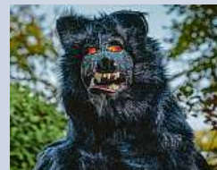
Umrlci, ježibaby, kostlivci a další v liberecké zoo ČTK

Svoji největší akci roku chystá ještě dnes večer liberecká zoo. Přijdou tam strašidla, duchové, záhrobní bytosti i ježibaby. Zájemci se mohou těšit na různá tajuplná zákoutí, statické instalace i živá strašidla, která se nebudou bát na nikoho bafnout či sáhnout. ČTK