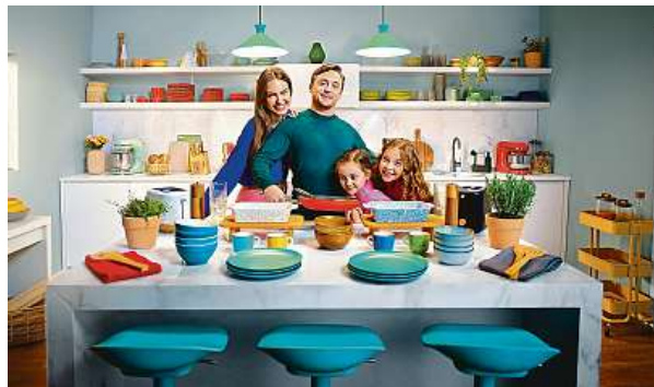
Kaufland.cz láká zejména na široký výběr s miliony produktů. KAUF LAND

V současné chvíli nabízí on-line marketplace více než pět milionů produktů od 4000 prodejců ve více než 6400 kategoriích. Každý čtvrtý prodejce pochází přímo z České republiky. Stránky Kaufland.cz navštěvuje měsíčně již více než 5,5 milionu on-line zájemců. Jedním z nej-