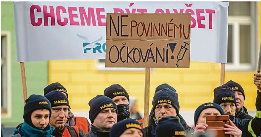
Odpůrci očkování se nejvíce hlásili ke slovu během covidu. Vakcinace proti černému kašli u dospělých ale může ochránit v rámci rodiny novorozence, kteří ještě proti pertusi očkovaní být nemohou.

Po relativně dlouhém období klidu teď opět vykazují statistiky nárůst černého kašle jak v Česku, tak ve zbytku Evropy. „Alarmující je, že podle dostupných hlášení dochází k lokálnímu výskytu u neočkovaných dětí,“ upozorňuje