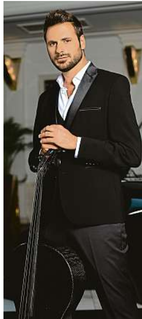
Violoncellista Stjepan Hauser vystoupí v Praze. 2x BRAINZONE

Každý koncert je trochu jiný, v tom je krása živého hraní. Ale naše odhodlání odehrát co nejlepší show zůstává stále stejné. Praha bude jedním z největších koncertů, které jsme zatím na turné odehráli. Je skvělé, že tolik lidí v České republice se spojuje s mou hudbou. Jsem za to nesmírně vděčný. A čím větší bude publikum, tím větší pártý. To je jen jeden z důvodů, proč se nemůžu dočkat návratu do Prahy.