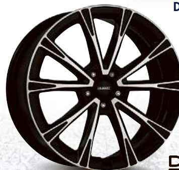
DEZENT AR dark 18", 19", 20"