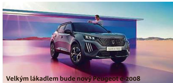
Velkým lákadlem bude nový Peugeot e-2008

V halách 3, 4, 5 a 2D nebudou chybět ani modely domácí automobilky Škoda, dále pak vozy značek Dacia, Opel, Alfa Romeo, Jeep, Fiat, Renault, MG, Mitsubishi a mnoho dalších. Z importérů se budou prezentovat také značky Tesla a Ford. V letošním roce se na veletrhu rovněž představí nákladní e-trucky značek Mercedes-Benz, Volvo a Scania.