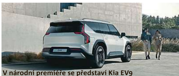
V národní premiéře se představí Kia EV9

tromobily a hybridy doplní přehlídka elektromotorek, elektrokol a dalších vozítek