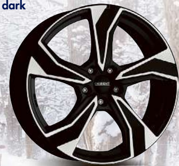
DEZENT KB dark 16", 17", 18", 19"