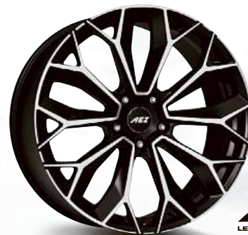
AEZ Leipzig dark 20", 21" 22"