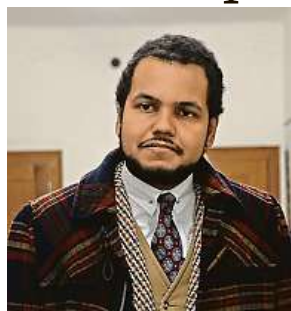
U soudu v únoru