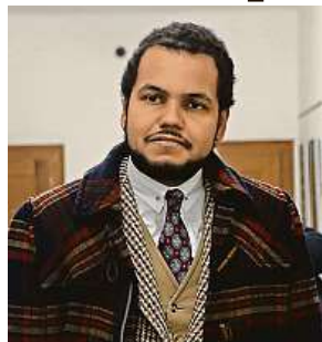
U soudu v únoru