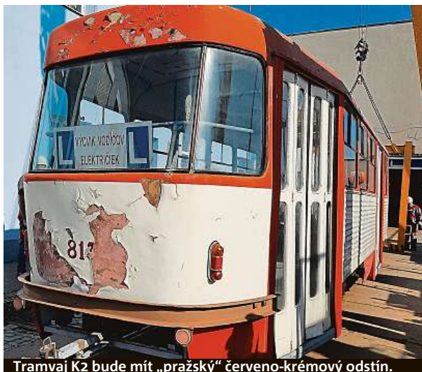
Tramvaj K2 bude mít „pražský“ červeno-krémový odstín.