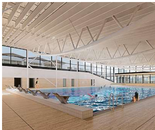
Vizualizace plaveckého bazénu

Díky nápadu a iniciativě bývalého fotbalisty Petra Švan-