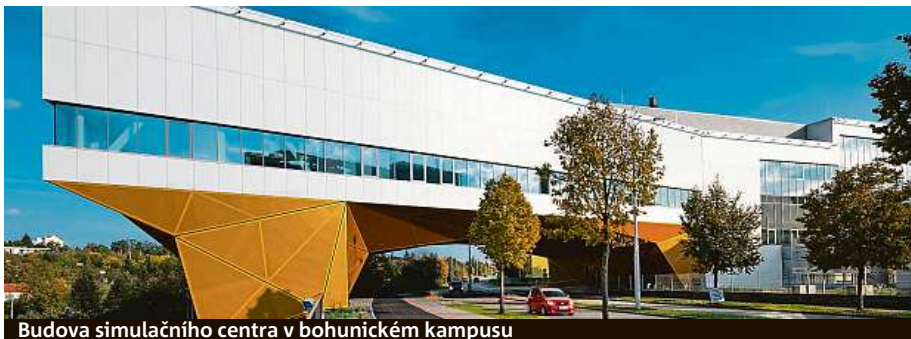
Budova simulačního centra v bohunickém kampusu

Odběr krve, zašití rány, intubace pacienta, ale i nácvik porodu, záchrany při hromadném neštěstí nebo výpadku proudu na operačním sále. Běžné postupy i krizové situace si mohou budoucí lékaři a zdravotníci už rok trénovat v Simulačním centru Lékařské fakulty Masarykovy univerzity (SIMU). Pětipatrová dominanta bohunického kampusu je v provozu od září loňského roku. Svou rozlohou přes osm tisíc metrů čtverečních a více než tisícem simulátorů je brněnské SIMU největší v Evropě. Výuka ve cvičné nemocnici studenty připravuje na budoucí kontakt s pacienty. Od letošního