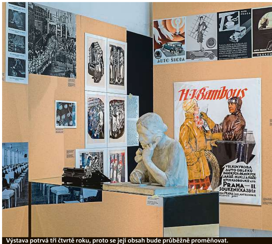
Výstava potrvá tři čtvrtě roku, proto se její obsah bude průběžně proměňovat.

Závěr výstavy je věnován reformě domácnosti, místu, s nímž prvorepubliková společnost – dobovému feminismu navzdory – ženy nadále svazovala. RADEK BABIČKA