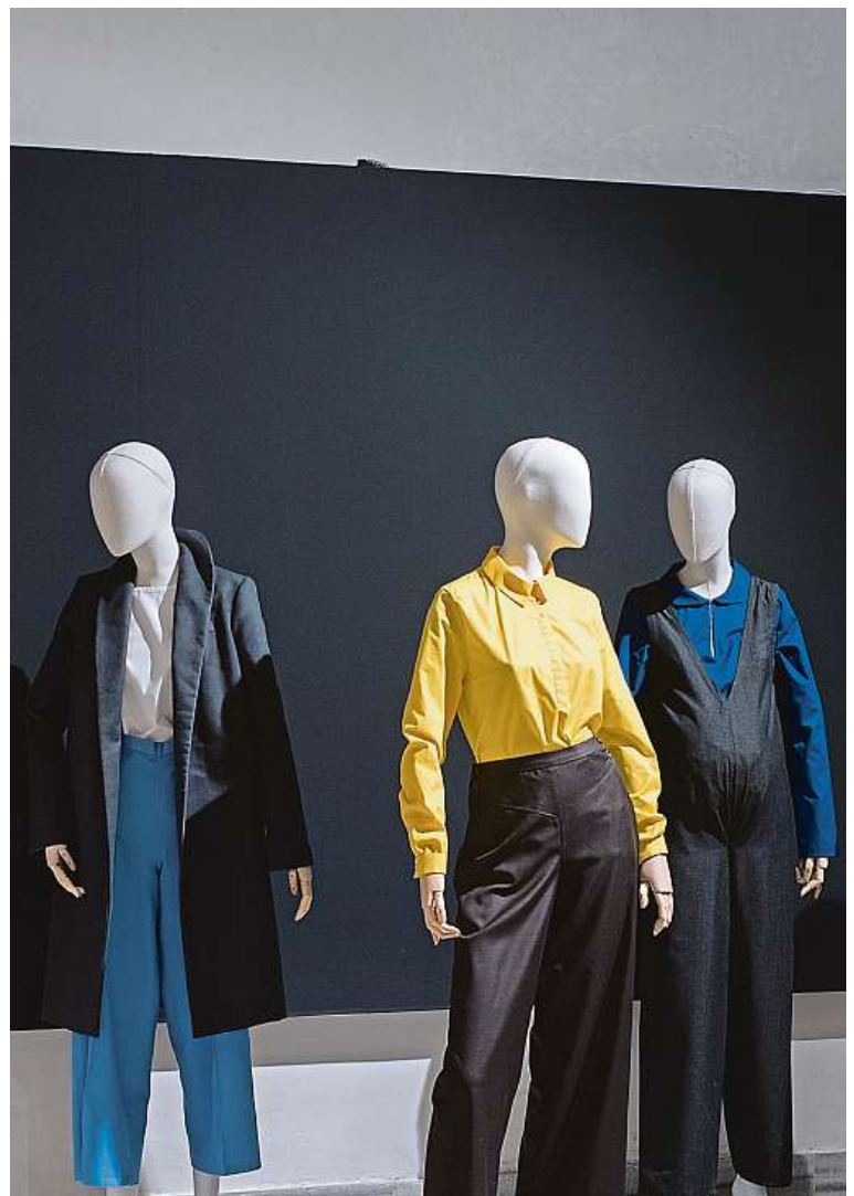
Výstava se věnuje také oblékání žen.

Kovolit, a. s., Nádražní 344, 664 42 Modřice, tel.: +420 532 157 111, www.kovolit.cz