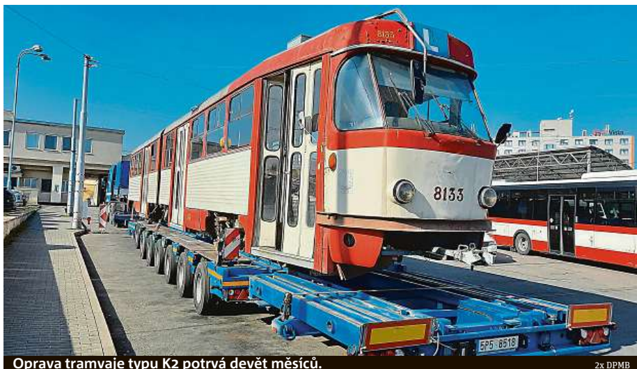
Oprava tramvaje typu K2 potrvá devět měsíců.