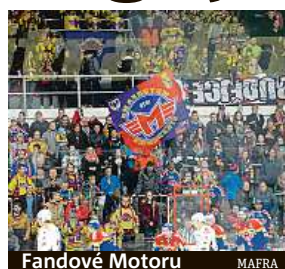
Fandové Motoru MAFRA

Československá Budvar aréna je nejdéle kontinuálně fungujícím zimním stadionem v Česku. Otevřena byla 27. října 1946 jako teprve třetí zimní stadion s umělou ledovou plochou v zemi, a to po Praze a Bratislavě. V roce 1967 pak stadion dostal zastřešení a o 12 let později i druhou ledovou plochu. V současnosti je hala, která je majetkem města, domovským stánkem hokejistů HC Motor České Budějovice.