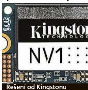
Řešení od Kingstonu

ků tedy neobsahuje žádné pohyblivé části a díky tomu nabízí nejen mnohonásobně vyšší rychlost a odolnost, ale i nižší spotřebu a právě naprosto tichý chod. Tento rozdíl se projeví při každodenním použití, ať už se to týká startování operačního systému, surfování po internetu, úpravy fotek a videa, nebo hraní her.