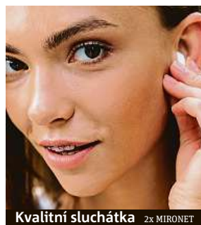
Kvalitní sluchátka 2x MIRONET

Z několika dalších možností můžete též volit například „Ultra režim“ pro hluboké potlačení okolního hluku a naprosto nerušený poslech. Prodyšný design sluchátek FreeBuds Pro propojuje vzduch uvnitř ucha s vnějším prostředím, které jinak bývá sluchátkem odděleno, díky tomu ne-