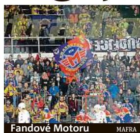
Fandové Motoru MAFRA

Československá Budvar aréna je nejdéle kontinuálně fungujícím zimním stadionem v Česku. Otevřena byla 27. října 1946 jako teprve třetí zimní stadion s umělou ledovou plochou v zemi, a to po Praze a Bratislavě. V roce 1967 pak stadion dostal zastřešení a o 12 let později i druhou ledovou plochu. V současnosti je hala, která je majetkem města, domovským stánkem hokejistů HC Motor České Budějovice.