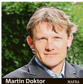
Martin Doktor

Výjimku budou mít jen jednotlivci, kteří se nemohou naočkovat ze zdravotních důvodů. O nikom takovém v českých barvách zatím Doktor neví. „Mám hlasy ze sportovních svazů, a co jsem většínou dostal, bylo, že všichni jsou naočkovaní. Dohromady těch nenačkovaných s výjimkou hokejistů budou jed-