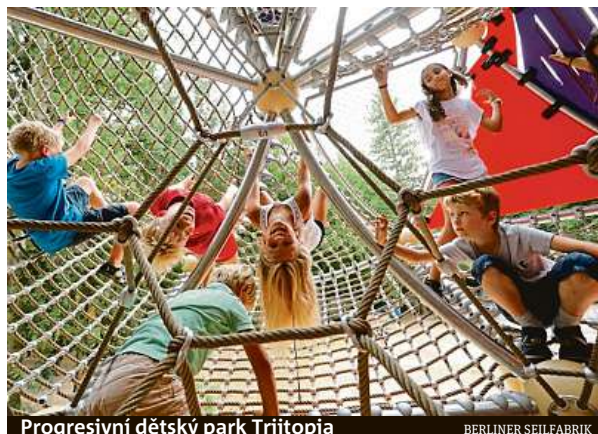
Progressivní dětský park Triitopia

Stále více pedagogů, výrobců a urbanistů tvrdí, že dětská hřiště musí přestat usilovat o absolutní bezpečnost