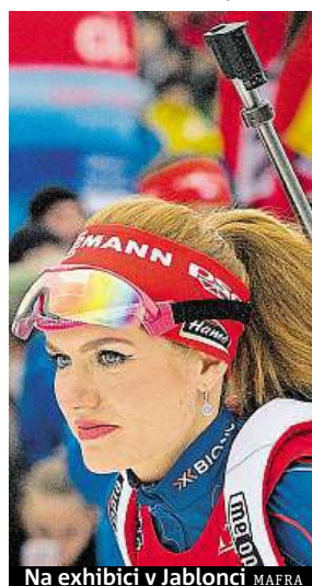
Na exhibici v Jablonci

Sedmadvacetiletá Koukalová v létě pět týdnů netrénovala vůbec a pak měla vlastní režim uzpůsobený tomu, co jí zdraví dovolí. Tak to zůstane