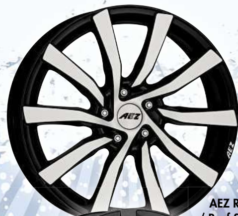
AEZ Reef / Reef SUV