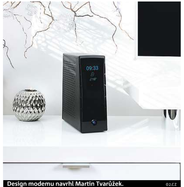
Design modemu navrhl Martin Tvarůžek.

O2 Smart Box navíc využívá nové služby Internet HD, díky kterým se vám už nikdy nezpomalí obraz videí na internetu. Internet HD představuje stabilní řešení, které umožní dopřát si špičkový audiovizuální zážitek až 99 procentům českých domácností. „Devadesát