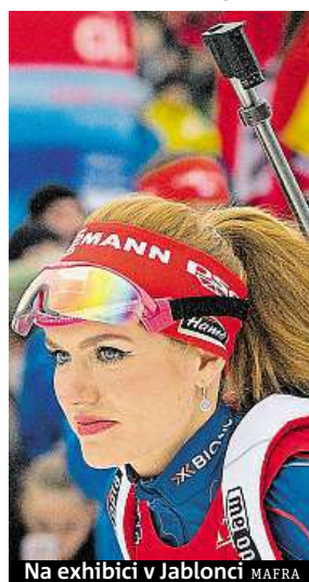
Na exhibici v Jablonci MAFRA

Sedmadvacetiletá Koukalová v létě pět týdnů netrénovala vůbec a pak měla vlastní režim uzpůsobený tomu, co jí zdraví dovolí. Tak to zůstane