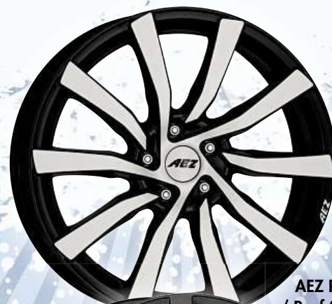
AEZ Reef / Reef SUV