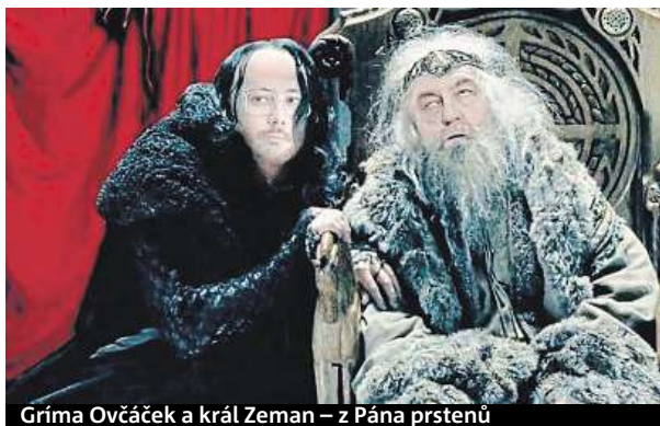
Gríma Ovčáček a král Zeman – z Pána prstenů