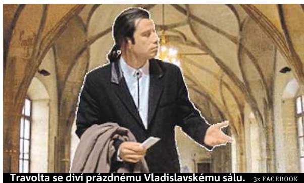
Travolta se diví prázdnému Vladislavskému sálu.