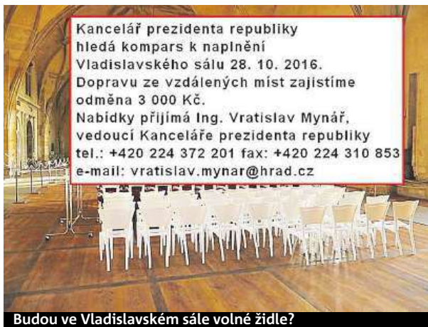
Budou ve Vladislavském sále volné židle?