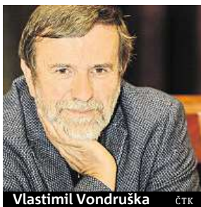
Vlastimil Vondruška ČTK

Popsal jsem určitý pohled na dějiny se vztahem k současnosti. Kdo chce, ať se poučí, kdo nechce, tak ať chyby dělá dál, říká spisovatel Vondruška.