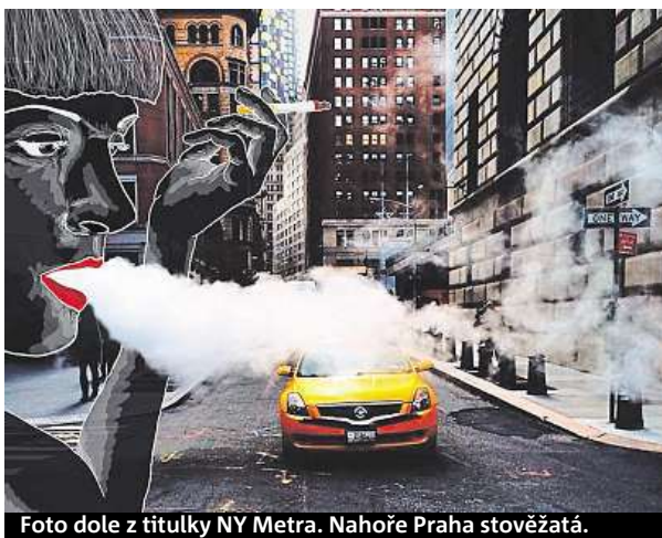
Foto dole z titulky NY Metra. Nahoře Praha stověžatá.