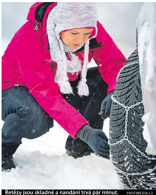
Řetězy jsou skladné a nandání trvá pár minut.

U auta s pohonem všech kol si motoristé musí dát pozor na to, jestli výrobce nenarizuje použití řetězů na obou hnaných nápravách. „Hodně řidičů s těžkými SUV vozy s pohonem 4x4 a kvalitními zimními pneumatikami přestává mít potřebu se řetězy vybavovat. Na všechno čtyřkolky rozhodně nestačí. Zabrzdít rozjeté těžké SUV při jízdě z kopce nebo do zatáčky na ujetém či uklouzaném sněhu je opravdu nebezpečný zážitek. Řetězy doporučuji