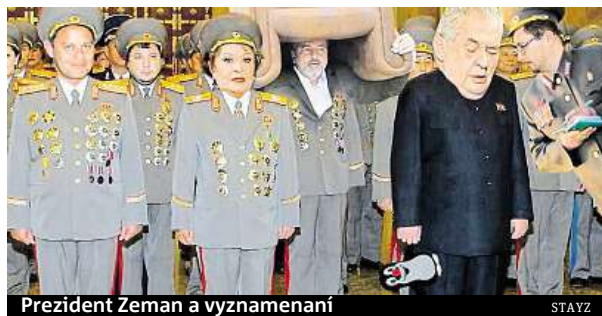
Prezident Zeman a vyznamenání STAYZ