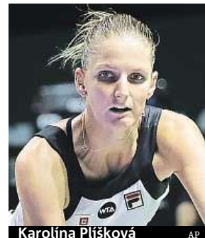
Karolína Plíšková

Česka ve druhém duelu na Turnaji mistryň prohrála s Ruskou Kuzněcovou 6:3, 2:6 a 6:7.