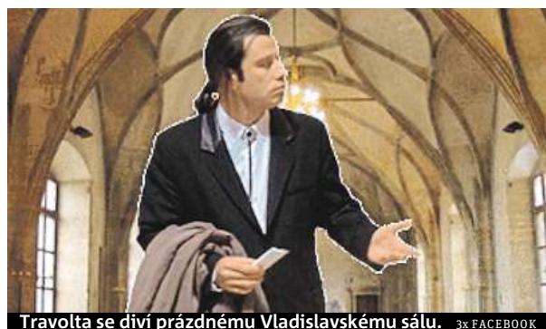
Travolta se diví prázdnému Vladislavskému sálu.