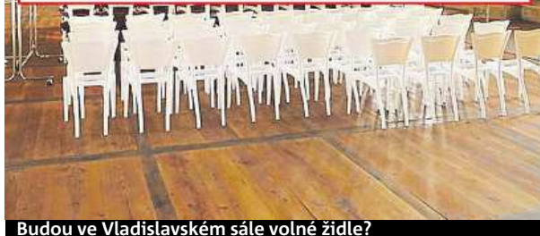
Budou ve Vladislavském sále volné židle?