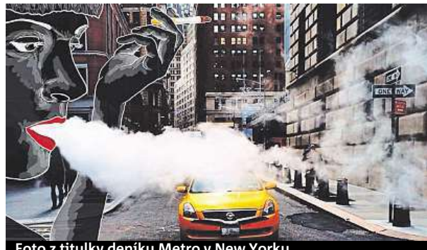
Foto z titulky deníku Metro v New Yorku

Teď se tolik tomu nevěnuji, ale byla to hodně intenzivní práce. Tenkrát jsem vytvářela a sdílela dva obrázky denně. Máte následně okamžitou zpětnou vazbu. Právě na Instagramu je velká newyorská komunita a lidé z ní mě začali oslovovat, jestli bych jim neupravila jejich obrázky. Dostala jsem se do povědomí těch, kteří fotí a žijí v New Yorku, a potom si mě i všiml newyorský deník Metro. Na jejich titulce vyšel obraz, kterému pracovně říkám Pulp Fiction.