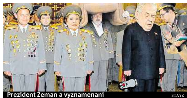
Prezident Zeman a vyznamenání STAYZ