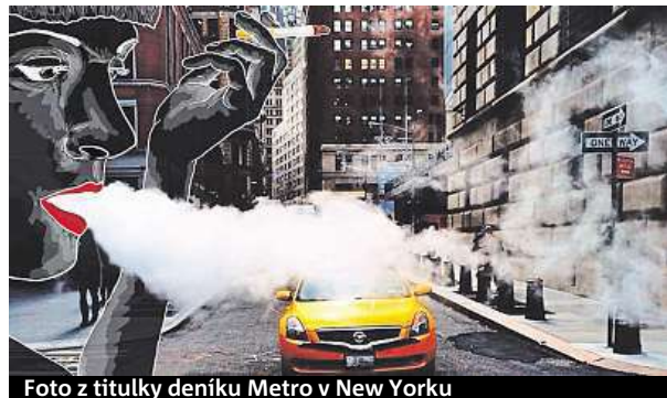
Foto z titulky deníku Metro v New Yorku

Teď se tolik tomu nevěnuji, ale byla to hodně intenzivní práce. Tenkrát jsem vytvářela a sdílela dva obrázky denně. Máte následně okamžitou zpětnou vazbu. Právě na Instagramu je velká newyorská komunita a lidé z ní mě začali oslovovat, jestli bych jim neupravila jejich obrázky. Dostala jsem se do povědomí těch, kteří fotí a žijí v New Yorku, a potom si mě i všiml newyorský deník Metro. Na jejich titulce vyšel obraz, kterému pracovně říkám Pulp Fiction.