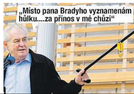
G. CZ, FACEBOOK