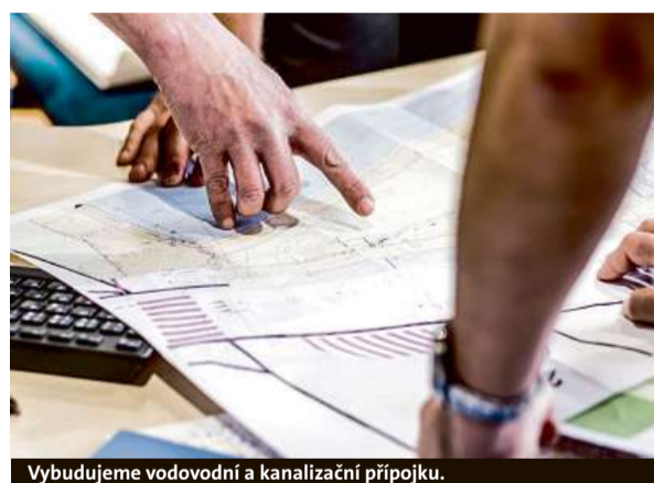
Vybudujeme vodovodní a kanalizační přípojku.

Na obou platformách mohou zákazníci vyřídít vybrané požadavky on-line, jako například změnu nastavení úhrad, smluvního vztahu, on-line