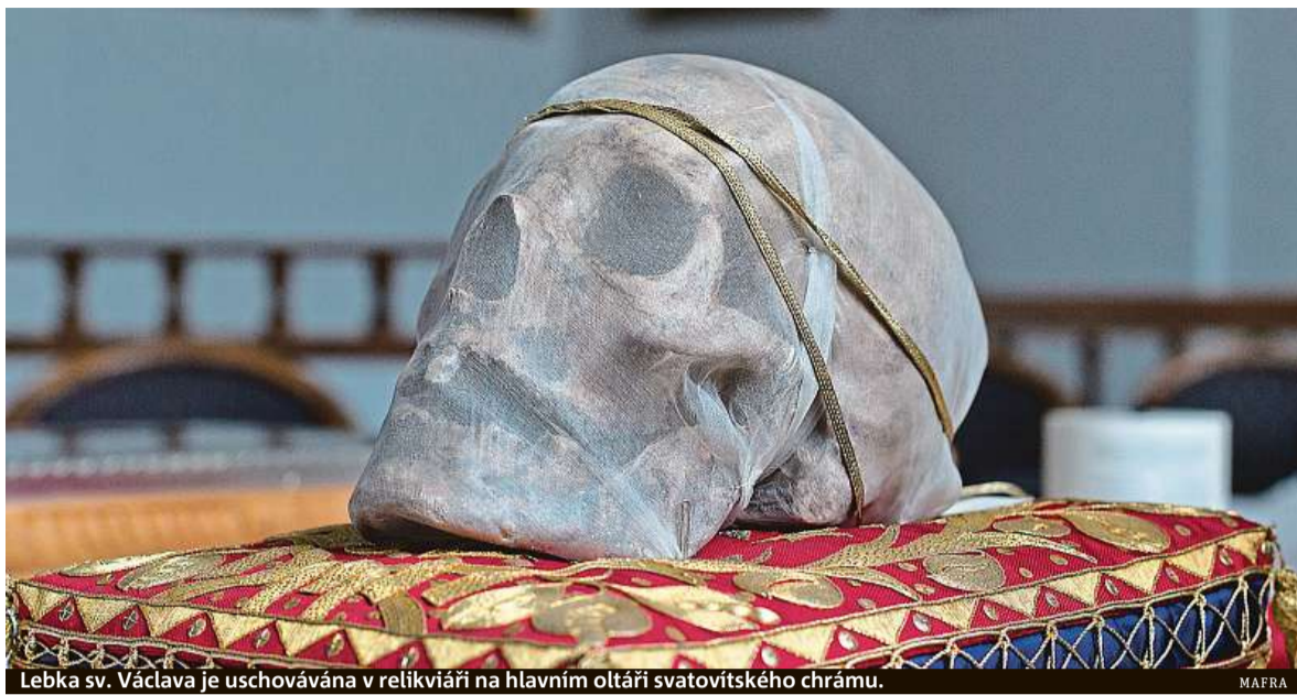
Lebka sv. Václava je uschovávána v relikviáři na hlavním oltáři svatovítského chrámu.

Některé nepřímé zprávy naznačují, že snad mohl být kníže Václav i ženatý. O jeho rodině ale nevíme nic bližšího. Není nic známo o tom, že by Václav měl potomky. Legendy, které popisují život knížete, se snaží zdůraznit Václavovu zbožnost a jeho přínos pro šíření křesťanství v Čechách. Osobní život vládců tak na základě těchto textů působí jednostranně, jako bychom sledovali pouze ži-