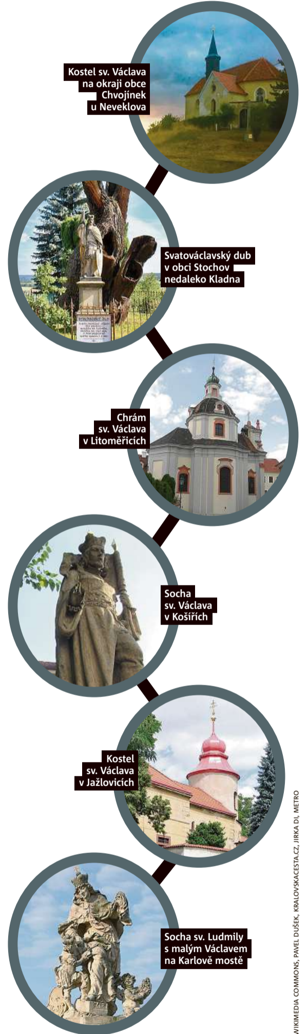
Kostel sv. Václava na okraji obce Chvojčinek u Neveklova

Na chvíli zapomeňte na kapli sv. Václava v katedrále sv. Víta nebo slavnou Myslbekovu sochu na Václavském náměstí. Ty by mělo znát každé malé dítě. Podívejte se na tyto méně známé stavby, které nesou jméno slavné osobnosti naší historie. Uděláte-li si k nim výlet a vyfotíte-li se s nimi osobně nebo s tímto vydáním deníku Metro, můžete vyhrát až 800 korun.