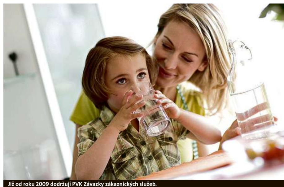
Již od roku 2009 dodržují PVK závazky zákaznických služeb.

Pokud jsou vaše vodovodní či kanalizační rozvody ve špatném stavu, plánujete novou výstavbu nebo rekonstrukci,