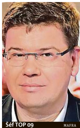
Šéf TOP 09

Volby 5. a 6. října Kandidáti na primátora