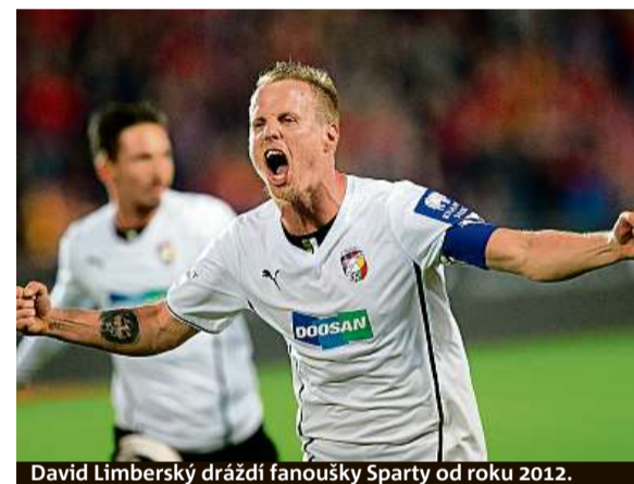
David Limberský dráždí fanoušky Sparty od roku 2012.