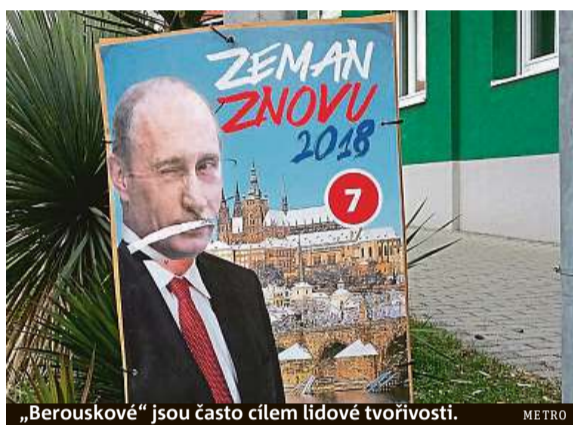
„Berouskové“ jsou často cílem lidové tvořivosti. METRO

Nebyly proto jakkoliv upřednostňovány větší politické subjekty, jež mají celopražskou působnost. Jednotlivé stožáry se reklamou osazovaly v průměru 29 dnů před termínem konání komunálních a senátních voleb. Cena za pronájem jednoho sloupu je symbolická – jedna koruna za sloup a den. Náklady na instalaci a následnou demontáž po volbách, (včetně nejméně jedné průběžné kontroly) vyjdou už na 280 korun bez DPH. Pokud strana dodala plakáty nalepené, za jejich instalaci na svítilny ušetřila šedesát korun za jednu lucernu. PH