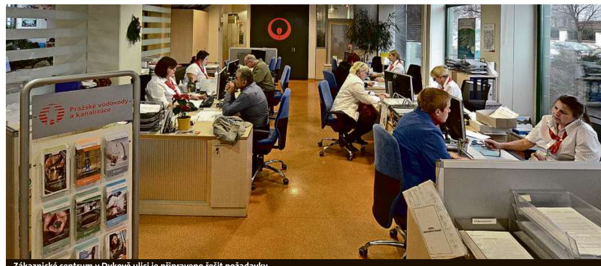
Zákaznické centrum v Dykové ulici je připraveno řešit požadavky.

Pražské vodovody a kanalizace, a. s. Ke Kably 971 102 00 Praha 10, Hostivař Fax: +420 272 172 390 E-mail: info@pvk.cz