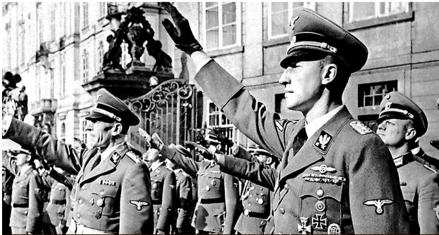
Zastupující říšský protektor Reinhard Heydrich míní, že důraz na svatováclavskou tradici může přiblížit Čechy hitlerovské říši.

Tradice spojená se sv. Václavem získávala zejména v moderní české minulosti nejen duchovní, ale i velmi silné politické konotace.