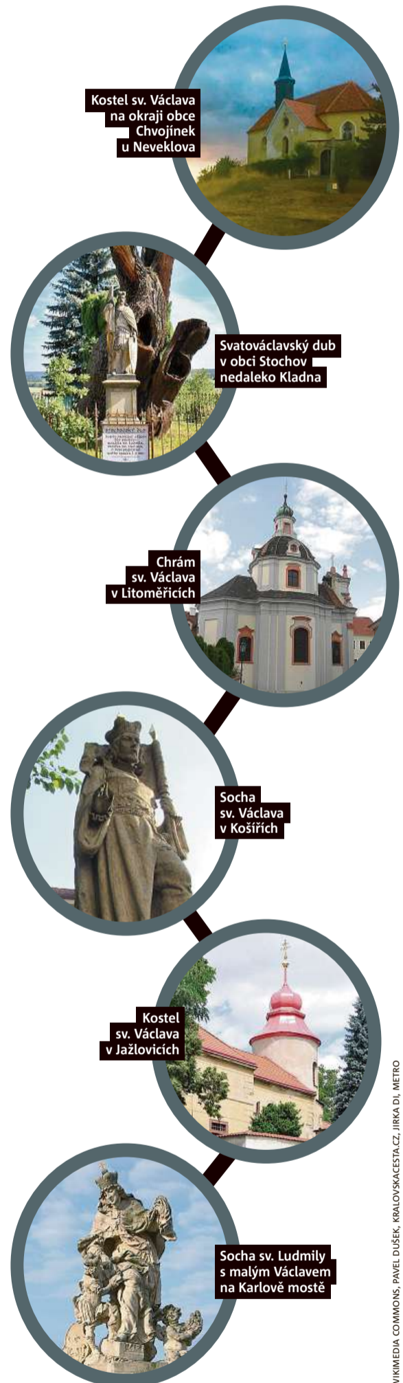
Kostel sv. Václava na okraji obce Chvojčinek u Neveklova

Na chvíli zapomeňte na kapli sv. Václava v katedrále sv. Víta nebo slavnou Myslbekovu sochu na Václavském náměstí. Ty by mělo znát každé malé dítě. Podívejte se na tyto méně známé stavby, které nesou jméno slavné osobnosti naší historie. Uděláte-li si k nim výlet a vyfotíte-li se s nimi osobně nebo s tímto vydáním deníku Metro, můžete vyhrát až 800 korun.