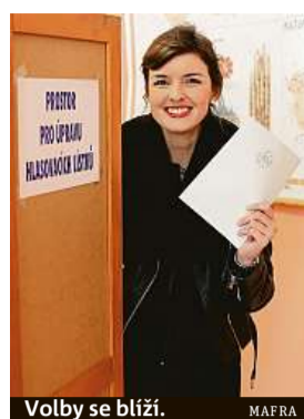
Volby se blíží.

Každý, kdo se dostaví volit, má hned tři možnosti, jak udělit hlasy. Má totiž celkem tolik hlasů, kolik má být v daném obvodu zvoleno zastupitelů. Příklad: pokud má městské zastupitelstvo dvacet členů, může volič zakřížkovat dvacet kandidátů na lístku (je-li jich tam tolik přihlášených). Kdyby ale celkově zakroužkoval víc než dvacet osob, jeho voličský hlas je neplatný, jako kdyby vůbec lístek nevhodil do urny. Pokud strana dá na svou kandidátku tolik lidí, kolik jich má dané zastupitelstvo, zakřížkováním jen u názvu strany dává volič hlasy všem kandidátům, kteří by se teoreticky mohli dostat do zastupitelstva všichni.