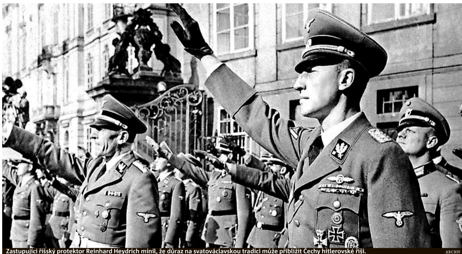
Zastupující říšský protektor Reinhard Heydrich míní, že důraz na svatováclavskou tradici může přiblížit Čechy hitlerovské říši.

Tradice spojená se sv. Václavem získávala zejména v moderní české minulosti nejen duchovní, ale i velmi silné politické konotace.