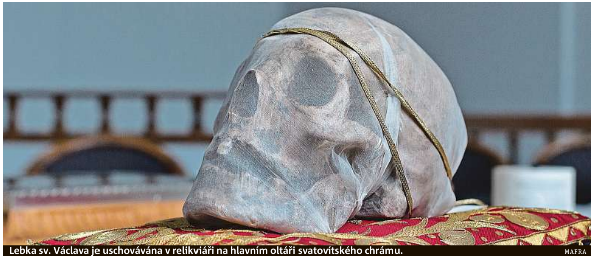
Lebka sv. Václava je uschovávána v relikviáři na hlavním oltáři svatovítského chrámu.

Václav byl už přemyslovskými knížaty považován za věčného vládce země, který živému panovníkovi vládu nad zemí pouze propůjčuje, za hlavního zemského patrona. Vyobrazení Václava se dostalo na mince, symbolem země se stala svatováclavská orlice. Svatováclavská legenda i svatováclavský chorál se staly také politickými symboly. Zobrazení světce na hranicích země nebo ve významných zahraničních církevních institucích jen posilovalo povědomí o českém státě i jeho významu. Václavův kult ještě dále posílil Karel IV., původním jménem Václav, který zemskému patrono-