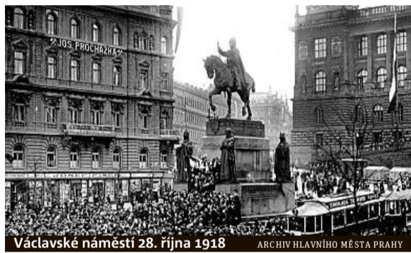
Václavské náměstí 28. října 1918