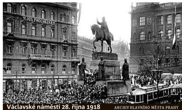
Václavské náměstí 28. října 1918

Rok 2018 se nese v duchu oslav stého výročí vyhlášení samostatného československého státu a tuto příležitost chce připomenout také Archiv hlavního města Prahy v rámci výstavy s názvem 28. říjen.