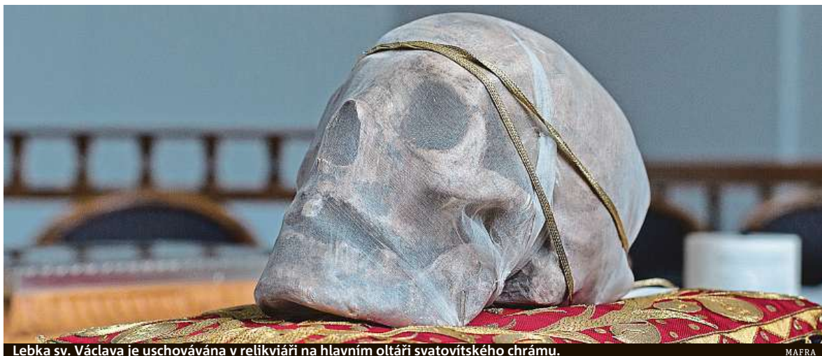
Lebka sv. Václava je uschovávána v relikviáři na hlavním oltáři svatovítského chrámu.

Václav byl už přemyslovskými knížaty považován za věčného vládce země, který živému panovníkovi vládu nad zemí pouze propůjčuje, za hlavního zemského patrona. Vyobrazení Václava se dostalo na mince, symbolem země se stala svatováclavská orlice. Svatováclavská legenda i svatováclavský chorál se staly také politickými symboly. Zobrazení světece na hranicích země nebo ve významných zahraničních církevních institucích jen posilovalo povědomí o českém státě i jeho významu. Václavův kult ještě dále posílil Karel IV., původním jménem Václav, který zemskému patrono-