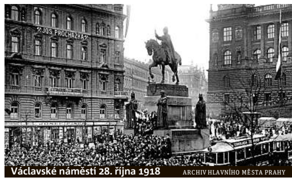
Václavské náměstí 28. října 1918

Rok 2018 se nese v duchu oslav stého výročí vyhlášení samostatného československého státu a tuto příležitost chce připomenout také Archiv hlavního města Prahy v rámci výstavy s názvem 28. říjen.