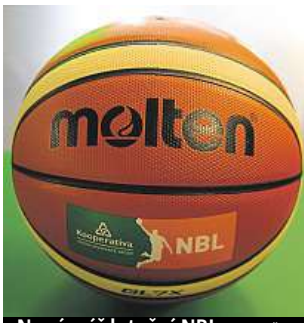
Nový míč letošní NBL ČTK

V pondělí odstartuje 26. ročník Kooperativa Národní basketbalové ligy (NBL), který slibuje vyrovnanější boje než v minulých ročnících. Především panuje očekávání, zda si svou suverenitu udrží šampion posledních 14 sezon, Nymburk. Prochází změnami ve vedení a výraznou obměnou kádru. Přesto zůstává jasným favoritem. Středočechy by měli tradičně proháňet Václavští z Děčína, kteří se po-