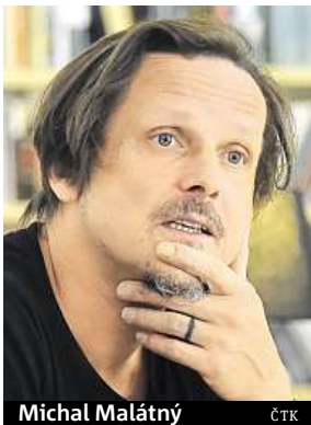
Michal Malátný

Připravované turné bude čtvrté halové v historii kapely. Zároveň má být největší a nejvýpravnější. Scéna bude postavena především na projekci, použita bude velká řada LED obrazovek. Některé budou dokonce pohyblivé, část se bude vysouvat nad hlavu diváků. Ty lidem umožní