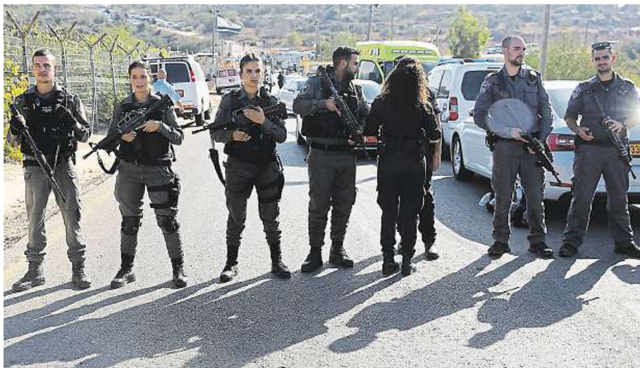
Izraelští policisté blokuji vstup k osadě Har Adar poblíž Jeruzaléma.

Mezi mrtvými jsou dva bezpečnostní strážci a jeden člen pohraniční policie. Podle izraelského tisku střelec pochá-