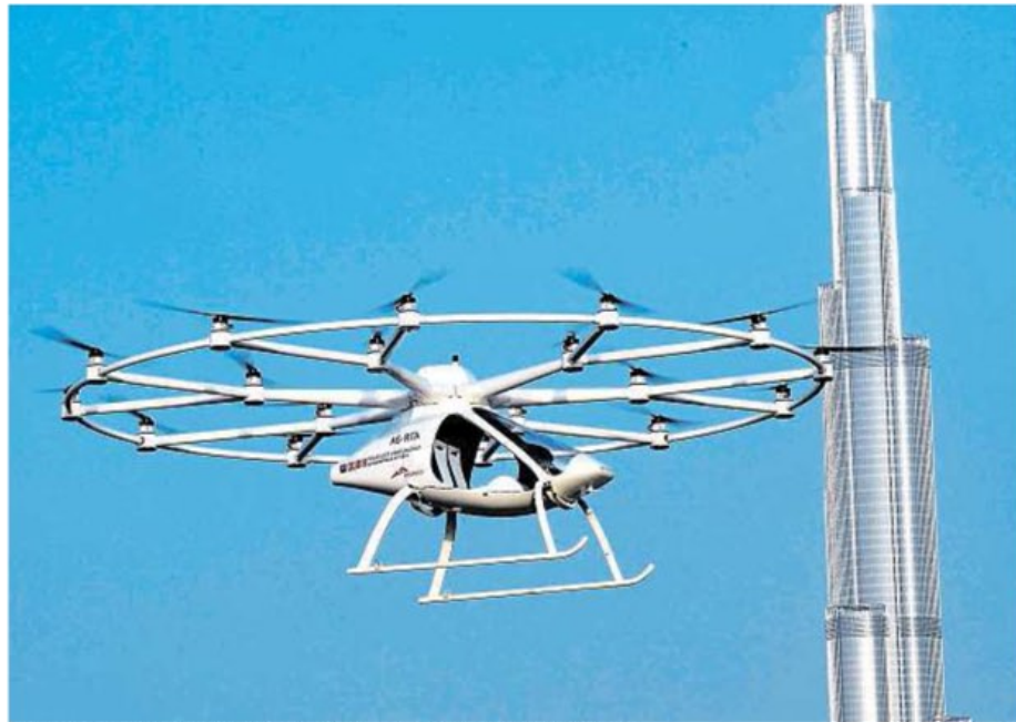
Stroj společnosti Volocopter při pondělním testu v Dubaji