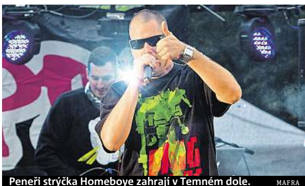
Peneři strýčka Homeboye zahrají v Temném dole.

Podle odborníků zaplatí každý Evropan ve společenských nákladech spojených s pitím v průměru okolo 300 eur ročně.