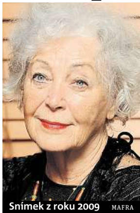
Snímek z roku 2009