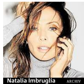
Natalie Imbruglia

Připomene ale i své hity, jako jsou Big Mistake , Smoke , That Day , Wrong Im-