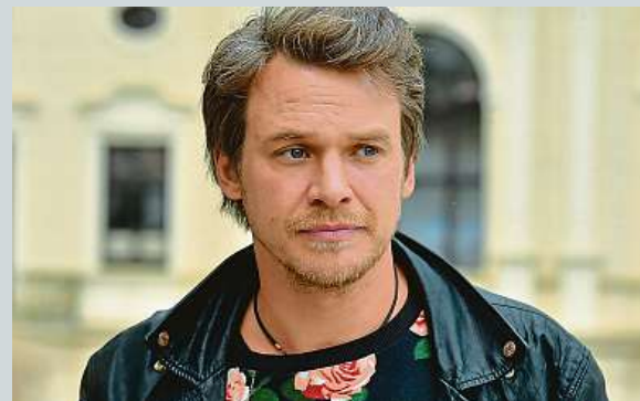
Vojtěch Dyk v Karlových Varech