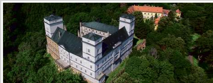
Zastavovaný areál zámku Račice v rámci dluhopisového programu e-Finance CZ v celkové hodnotě uveřejněné na adrese www.e-finance.eu/zajistene-dluhopisy .

Dluhopisy jsou zajištěné zástavním právem na celém exkluzivním areálu zámku Račice čítající pozemky o výměře přes 50 000 m 2 , nemovitosti a samotný zámek Račice.