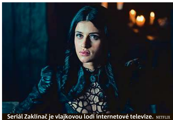
Seriál Zaklínač je vlajkovou lodí internetové televize.

„Podle zprávy serveru TorrentFreak proto Netflix začal blokovat IP adresy uživatelů, o nichž ví, že používají VPN. Vypadá to, že streamovací gigant některým uživatelům částečně omezil přístup k obsahu. Ti se pak prý dostanou jen k pořadům Netflix Originals, tedy k původním filmům a seriálům streamera, u nichž se nemusí řešit práva