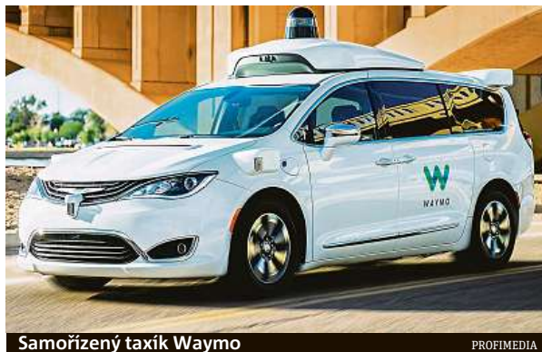
Samořizený taxík Waymo

Firma Waymo, která vsadila svou budoucnost na samořizené taxíky, začala s „ostřím“ testováním již v roce 2019, a to v arizonském Phoenixu, kde je mírný provoz a široké pravoúhlé bulváry. „Na předměstí Phoenixu Waymo poskytlo desítky tisíc jízd samořizených taxi vozů,