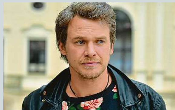
Vojtěch Dyk v Karlových Varech