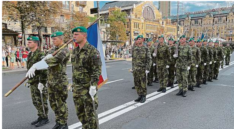
Ukrajinci vítají na přehlídce i české vojáky. V zemi, kde stále probíhá ozbrojený konflikt.