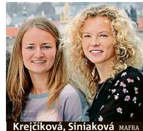
Krejčíková, Siniaková

Kateřina Siniaková a Barbora Krejčíková si spolu na US Open nezahrají.