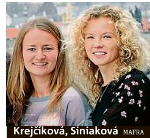
Krejčíková, Siniaková

Kateřina Siniaková a Barbora Krejčíková si spolu na US Open nezahrají.