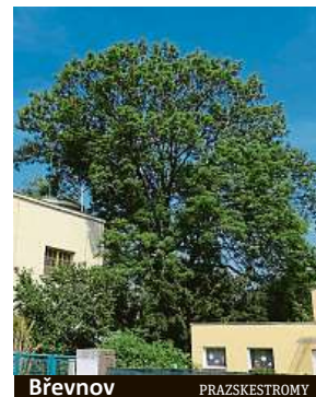
Břevnov PRAZSKÉ STROMY