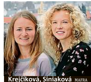
Krejčíková, Siniaková

Kateřina Siniaková a Barbora Krejčíková si spolu na US Open nezahrají.