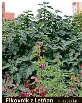
Fíkovník z Letňan P. KYSELÁK

„Jsou to identifikátory pro integrovaný záchranný systém,“ napsal ve skupině Letenská parta uživatel Max Hermel. Podle něj a mnoha dalších obyvatel Prahy 7 má tak každý strom, podobně jako lampy veřejného osvětlení, své číslo. To údajně pomáhá policistům nebo záchranářům najít například zraněnou osobu. S ním souhlasí početná skupina místních obyvatel. Ti mají obvykle za to, že jsou čísla umístěna pro veřejnost jako jakýsi rozlišovač jednotlivých dřevin.