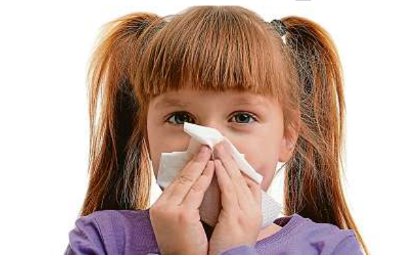
Nemoci se ve škole šíří doslova řetězově.

„Mezi tradiční tipy, jak posilovat obranyschopnost, patří pravidelný pohyb, zdravé a vyvážené stravování, notná dávka vitaminů hlavně z ovoce, zeleniny a kvalitního masa, dobrý spánek a vyplatí se nezapomínat ani na pitný režim,“ říká praktická lékařka Pavla Myslíková. K tomu ještě doporučuje přidávat pravidelné otužování. Na podzim a v zimě je rovněž dobré nepřetápět místnosti. „Přehřátý vzduch totiž vysušuje nosní sliznici a může tak docházet k usnadnění procesu