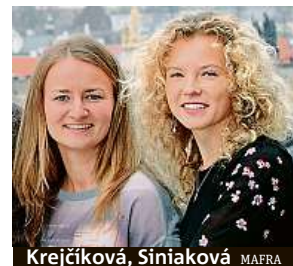
Krejčíková, Siniaková

Kateřina Siniaková a Barbora Krejčíková si spolu na US Open nezahrají.