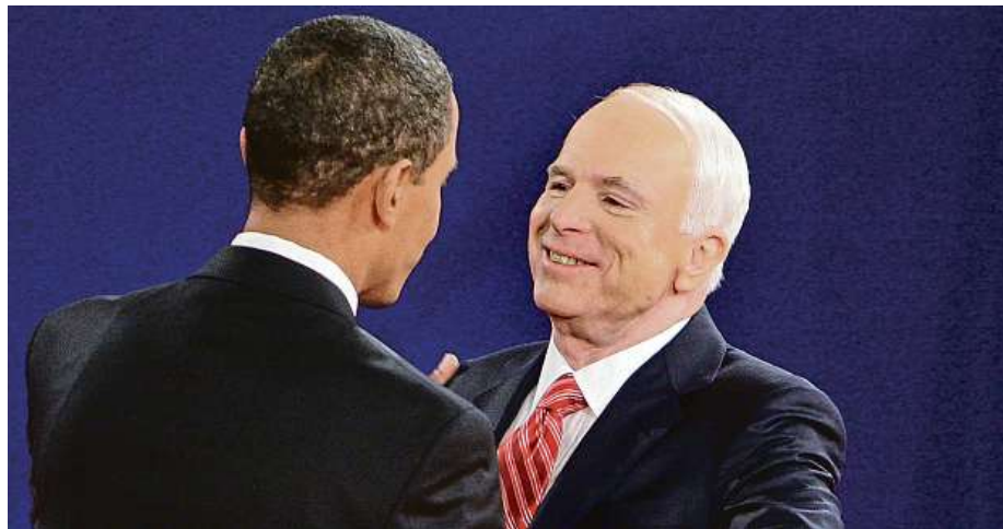
John McCain po debatě s Barackem Obamou při souboji o post prezidenta USA.