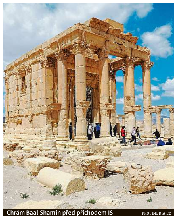
Chrám Baal-Shamin před příchodem IS

Islámský stát nelikvidoval památky jen v Palmýře, ale také ve starobylém syrském městě Nimrudu – tam na vzácné budovy vyjely buldozery, sochy zase rozbíjeli kladivem v muzeu v Mosulu. Sen o tom, že by se syrská Palmýra mohla opět v létě otevřít se sice pomalu zhmotňuje, přesto je problém ještě v tom, že Sýrie je stále neklidnou částí světa. MAP