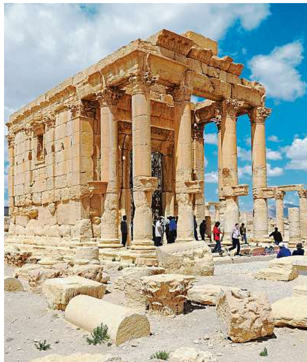
Chrám Baal-Shamin před příchodem IS

Islámský stát nelikvidoval památky jen v Palmýře, ale také ve starobylém syrském městě Nimrudu – tam na vzácné budovy vyjely buldozery, sochy zase rozbíjeli kladivem v muzeu v Mosulu. Sen o tom, že by se syrská Palmýra mohla opět v létě otevřít se sice pomalu zhmotňuje, přesto je problém ještě v tom, že Sýrie je stále neklidnou částí světa. MAP