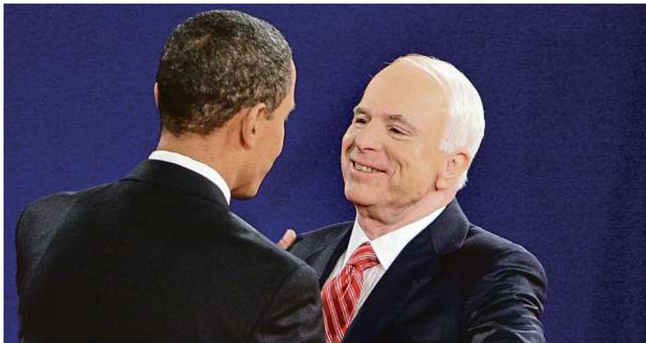
John McCain po debatě s Barackem Obamou při souboji o post prezidenta USA.