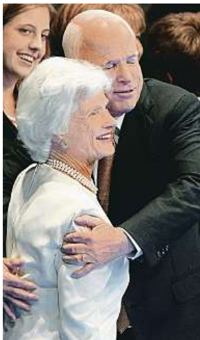
S matkou v roce 2008