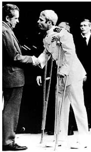
S prezidentem v roce 1973