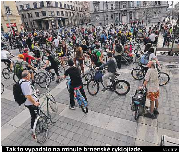
Tak to vypadalo na minulé brněnské cyklojízdě.