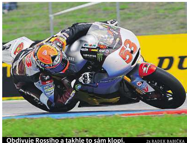
Obdivuje Rossiho a takhle to sám klopí.

Vůbec ne. Motokáry mě sice bavily, ale oproti závodění na motorkách to byl jen slabý odvar. Ten pocit, když to ve velké rychlosti klopíte v zatáčkách – a v dětství na minibiku vám jako obrovská rychlost přijde i třicet kilometrů za hodinu, je právě to, co