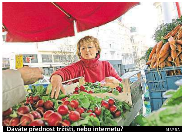
Dáváte přednost tržišti, nebo internetu? MAFRA