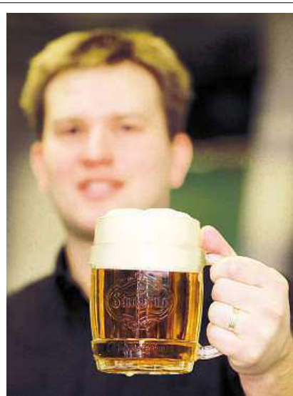
Měsíc chutí, vůní a zážitků

Po celé září můžete vybírat z těchto akcí: