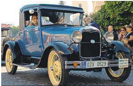
Přijedou tradiční skvosty vyrobené nejen v bývalém Československu.

K vidění by měly být sportovní legendy od Ferrari, Fordu, Chevroletu či Jaguaru, škodováčtí předchůdci dnešních octavií, luxusní vozy od MG nebo Tatry, nezaměnitelné kachny od Citroenu, brouci od Volkswagenu a hadráky Velorex. Českou motocyklovou výrobu zastoupí řada Jawa a „čežet“, historii zahraniční motocyklové výroby připomenou například britský Nor-