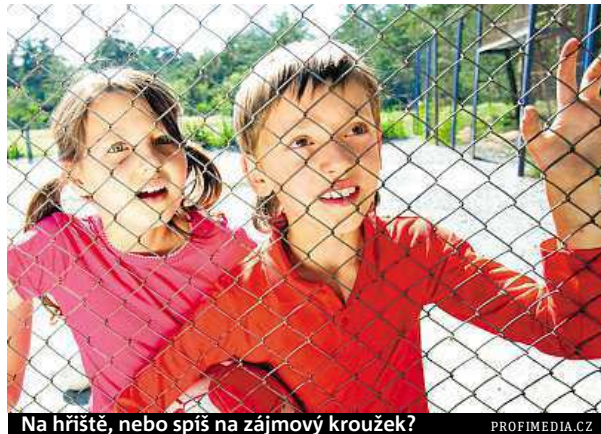
Na hřiště, nebo spíš na zájmový kroužek?

Pestrou nabídku kroužků přináší dětem tradičně i Středisko volného času Lužánky. To nabízí přes 550 kroužků pro děti všech věkových kategorií. „I letos reagujeme na zájem veřejnosti a otevíráme více než deset nových kroužků. Novinkami jsou terapeu-