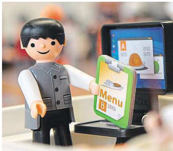
Plastová postavička zaujme malé i velké.