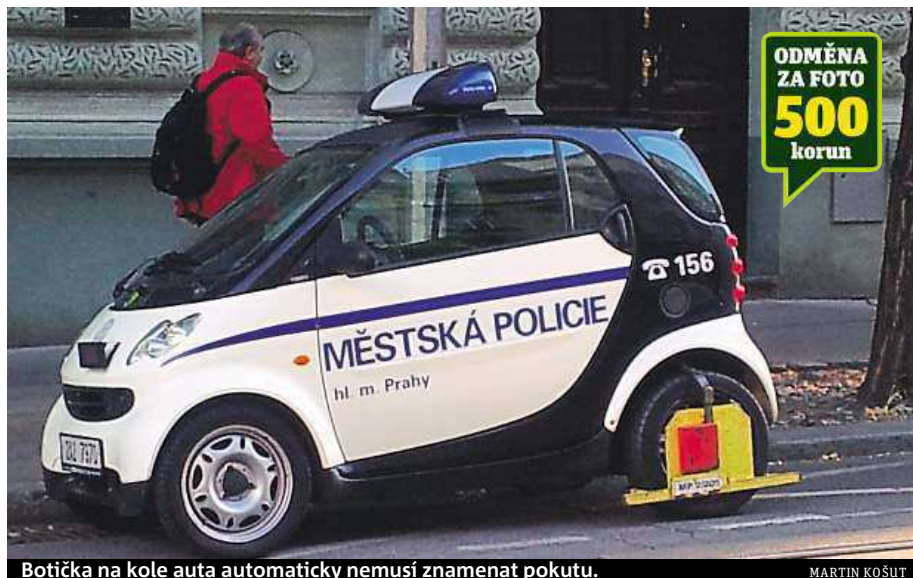
Botička na kole auta automaticky nemusí znamenat pokutu.