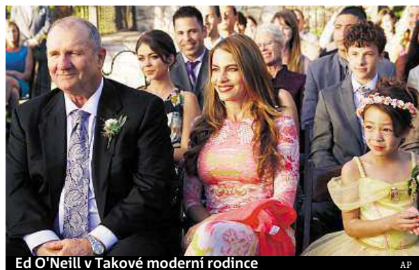
Ed O'Neill v Takové moderní rodince