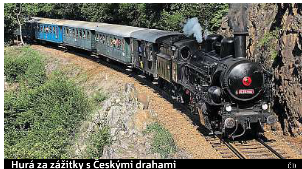
Hurá za zážitky s Českými drahami