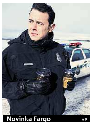
Novinka Fargo AP

Americkou televizní cenu Emmy za nejlepší komedii si odnesl seriál Taková moderní rodinka, prestižní ocenění získal již popáté za sebou. V kategorii nejlepší dramatický pořad pak uspěl seriál Perníkový táta, který se vysílá již od roku 2008. Ceny Emmy jsou považovány za obdobu filmových Oscarů.