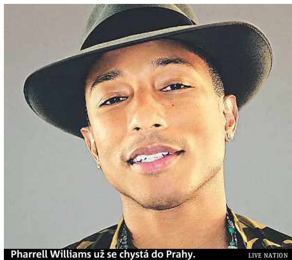
Pharrell Williams už se chystá do Prahy.

Pharrell Williams je držitelem již sedmi cen Grammy. Tento zpěvák, rapper, producent a skladatel je také zakladatelem labelu Star Trak Records a spoluzakladatelem módních značek Billionaire Boys Club a Ice Cream Clothing. Proto se oprávněně stal pro mnoho lidí módním guru. Vstupenky na koncert jsou v prodeji od května a jejich cena je od 990 korun. SAB