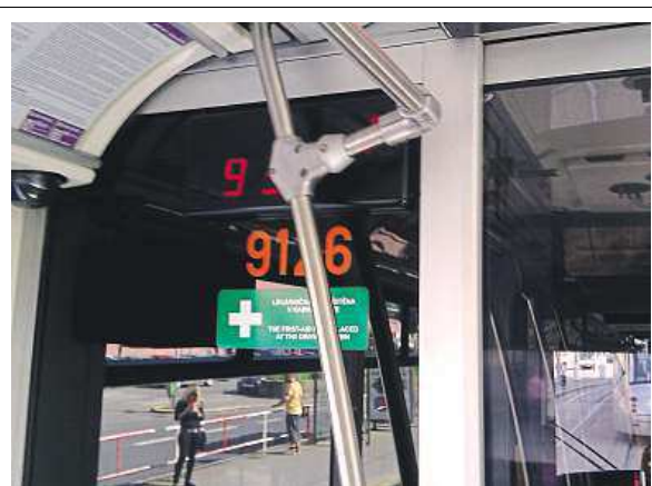
V tramvajích i autobusech se najdou věci proti logice

Od autobusů s označovací jízdenek, které překážejí při odkládání tašek do volného prostoru mezi sedadly, dává