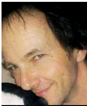
Podezřelý muž PČR

„Krátke před půl osmou ráno přijali operátoři linky 158 oznámení o útoku v ulici Na Záhonech. Na místo vyrazili policisté, kteří zjistili, že ve vestibulu domu u výtahu