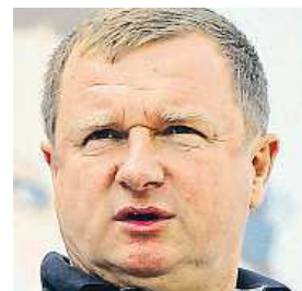
Petr Jiráček (Hamburk) Bořek Dočkal (Sparta) Vladimír Darida (Freiburg) Tomáš Hořava (Plzeň) Daniel Kolář (Plzeň) Václav Pilař (Plzeň) Ladislav Krejčí (Sparta)

Milan Petržela (Plzeň) Tomáš Rosický (Arsenal)