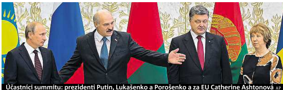
Účastníci summitu: prezidenti Putin, Lukašenko a Porošenko a za EU Catherine Ashtonová