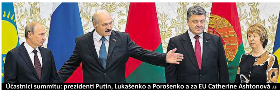
Účastníci summitu: prezidenti Putin, Lukašenko a Porošenko a za EU Catherine Ashtonová

Do konfliktu na východě Ukrajiny údajně zasáhla ruská armáda. Ukrajinci zajali ruské vřadkáře.