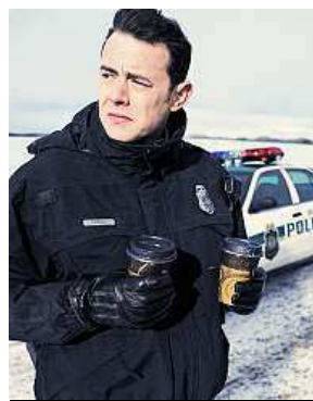
Novinka Fargo AP

Americkou televizní cenu Emmy za nejlepší komedii si odnesl seriál Taková moderní rodinka, prestižní ocenění získal již popáté za sebou. V kategorii nejlepší dramatický pořad pak uspěl seriál Perníkový táta, který se vysílá již od roku 2008. Ceny Emmy jsou považovány za obdobu filmových Oscarů.