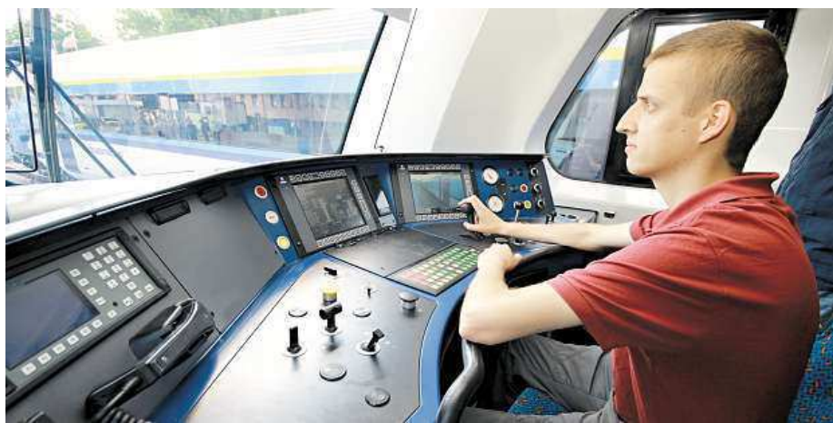
Nejdéle podle průzkumu setrvá na své pozici strojvedoucí.