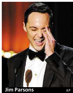
Jim Parsons

V hlavní roli seriálu Taková moderní rodinka vystupuje populární Ed O'Neill, kterého diváci znají ze sitkomu Že-