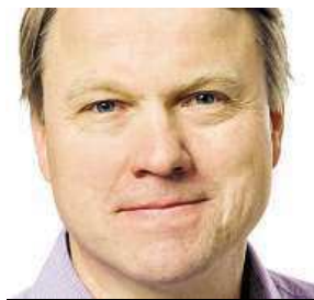
Martin Bursík TOP 09

Svě kandidáty vysílá do boje i TOP 09. Tím nejznámějším paradoxně ale není člen této strany, ale předseda nové strany LES a před tím Strany zelených Martin Bursík.