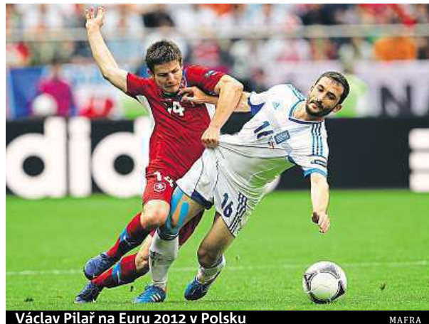
Václav Pilař na Euru 2012 v Polsku