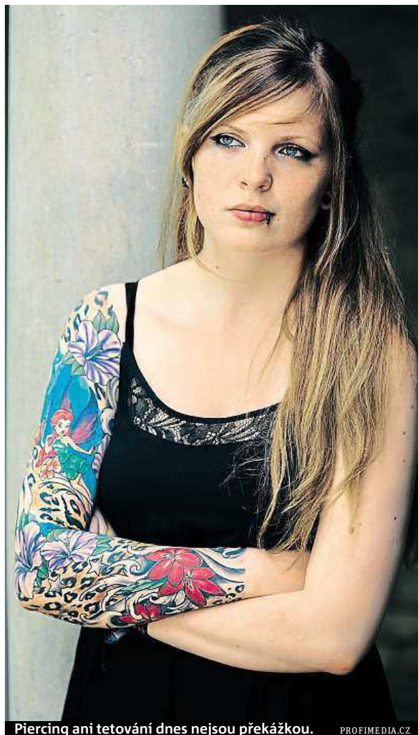
Piercing ani tetování dnes nejsou překážkou.

Naopak pozice, z nichž odchází lidé nejrychleji, jsou profese tazatele, pomocného kuchaře nebo makléře. V zaměstnání stráví pouze 1,3 roku. Ani dva roky v jednom zaměstnání nestráví hosteska, telefonní operátor, chůva, plavčík, promotér, krupíer nebo IT tester. ČTK