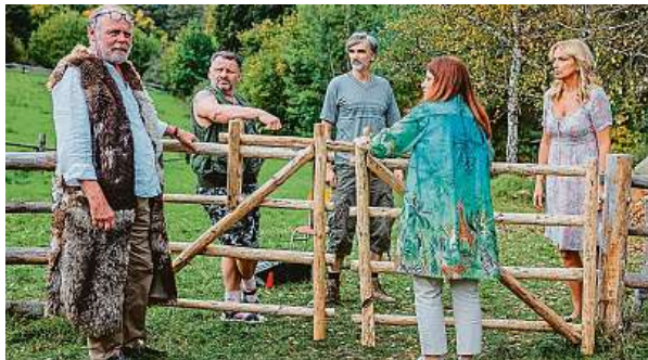
Fiktivní osada Záhoří se vrací na obrazovky ve druhé sérii.

Do malebného kraje Berounky a nižborských rybníků se po dvou letech vrátil štáb Radka Bajgara, aby ve fiktivní osadě Záhoří natočil druhou řadu komediálního seriálu Osada. „Scenárista Petr Koleč-