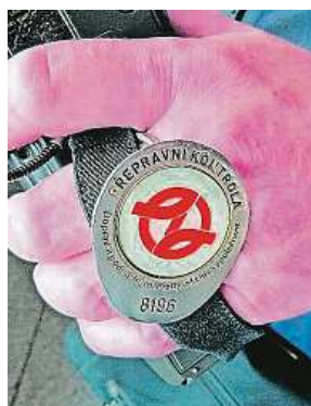
Revizorský odznak je symbolem přepravních kontrolorů. DPP