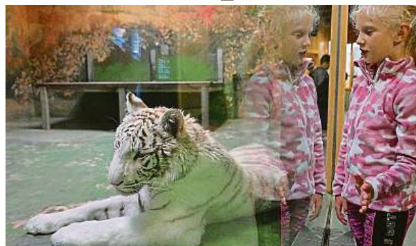
Tygřice Charlota žila s lidmi jako domácí mazlíček.