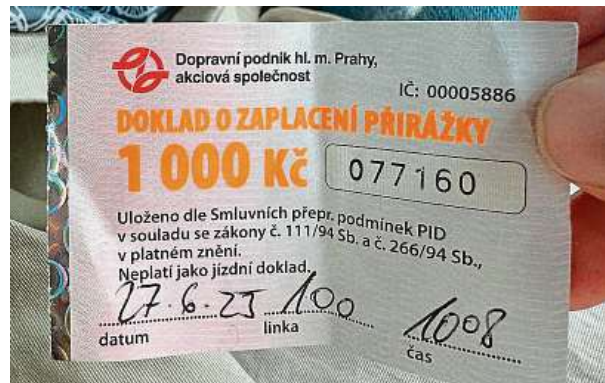
Revizoři dopravního podniku ročně zkontrolují řádově miliony cestujících. Čtenářka byla mezi nimi. MICHAELA BLŠŤÁKOVÁ