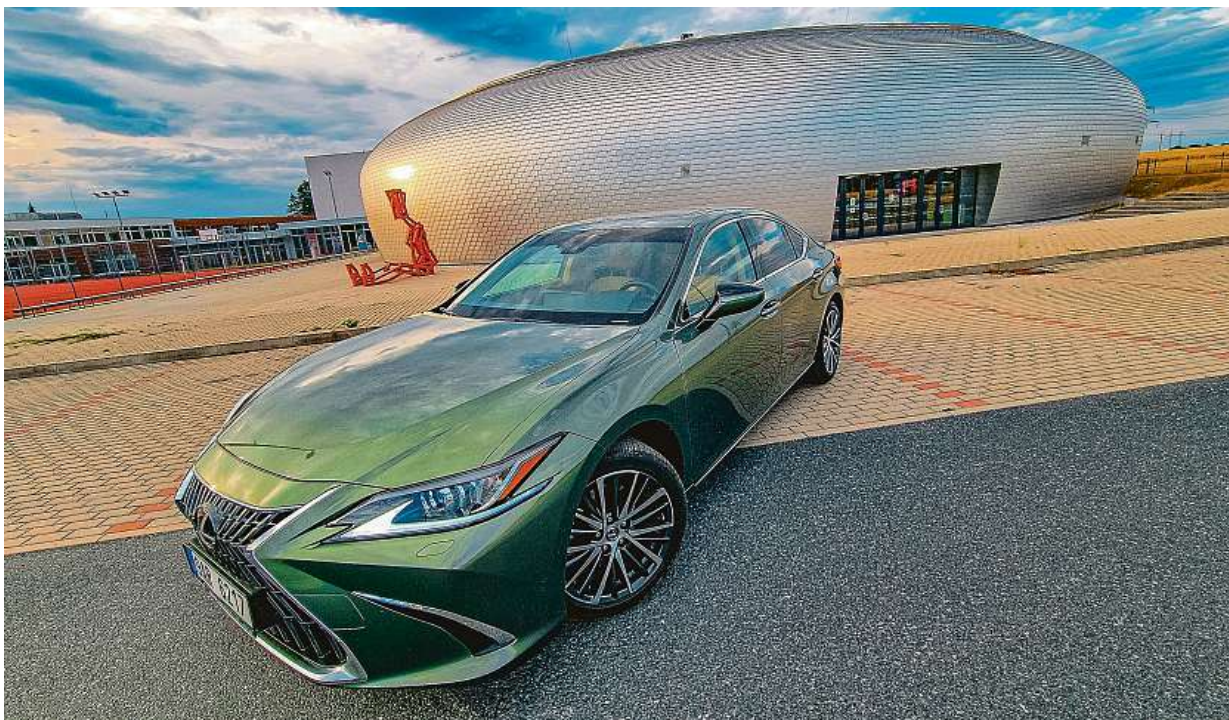
Zelená metalíza je za příplatek 30 tisíc. Podívejte se, jak vypadá v zapadajícím slunci před dolnobřežanskou sportovní halou. Celkový design je vůbec velmi milý, tvary jsou vyvážené tak, aby auto působilo jako origami, ale přitom ne nijak okázale ani nabuřele.