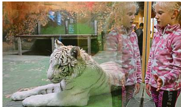
Tygřice Charlota žila s lidmi jako domácí mazlíček.