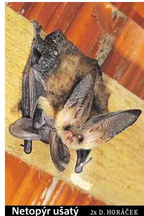
Netopýr ušatý