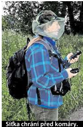
Sítka chrání před komáry.

Černí, severní i řasnatí. Ochránci přírody mapují netopýry ve středních Čechách.