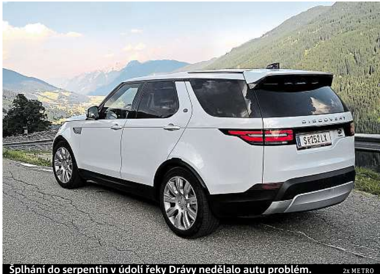
Splhání do serpentín v údolí řeky Drávy nedělalo autu problém.