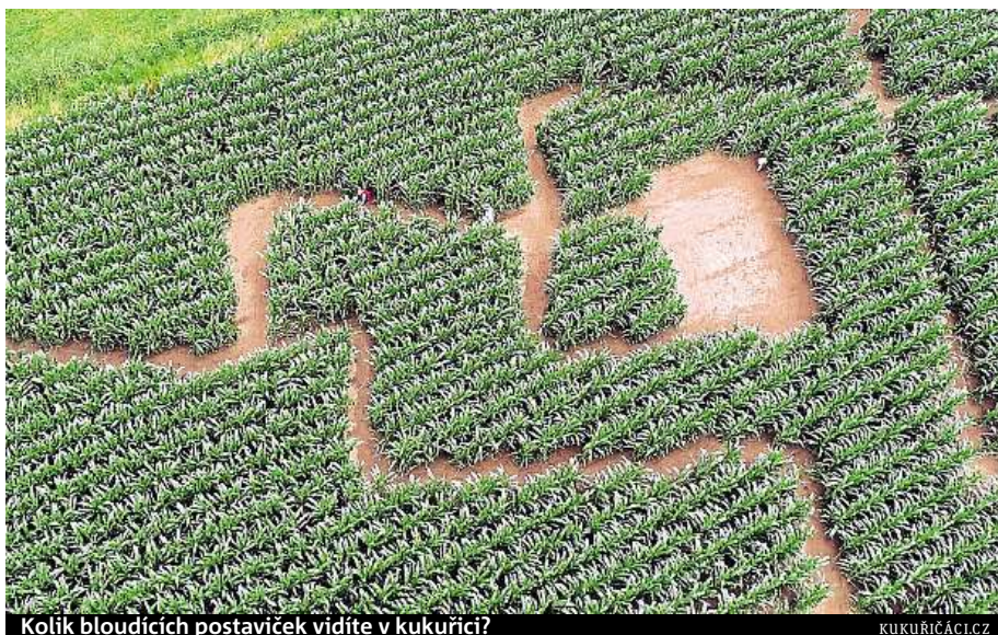
Kolik bloudících postavíček vidíte v kukuřici? KUKUŘIČÁCI.CZ

O projekt kukuřičných bludišť je velký zájem. Návštěvu