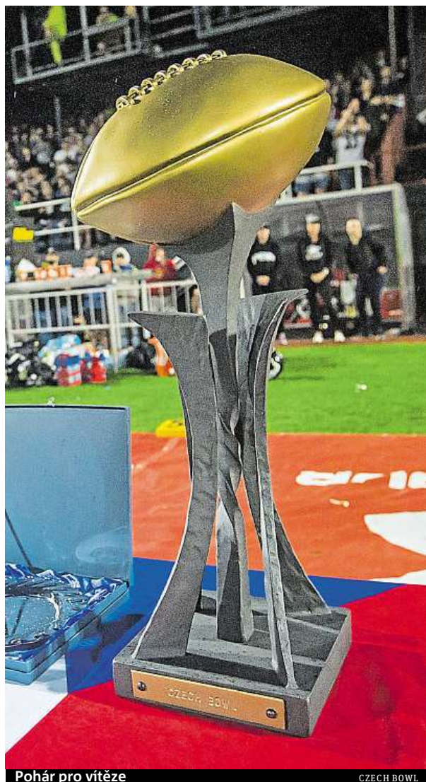
Pohár pro vítěze