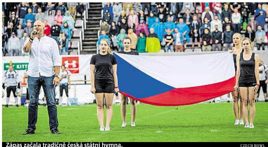
Zápas začala tradičně česká státní hymna.