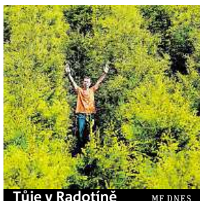
Túje v Radotíně MF DNES