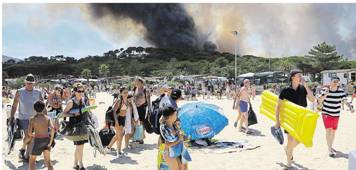
Z pláží na Azurovém pobřeží byli včera lidé evakuováni kvůli požárům. Na vině je sucho. Více čtěte na straně 7. AP

Nejhorší víkend roku. Delší cestě autem se radši vyhněte, radí odborníci. Prázdniny. Začínají v Bavorsku, další Němci se vrací od moře. Formule 1. Do Maďarska pojedou přes Česko davy fanoušků STRANA 5