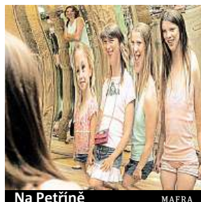
Na Petříně MAFRA