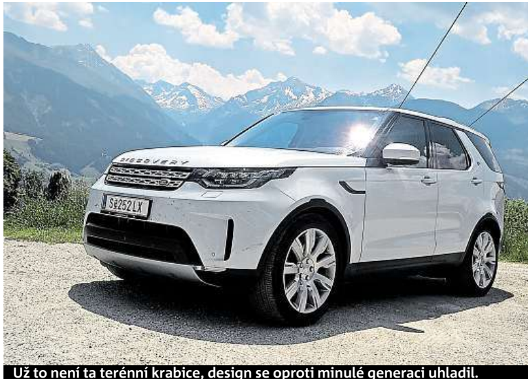
Už to není ta terénní krabice, design se oproti minulé generaci uhladil.