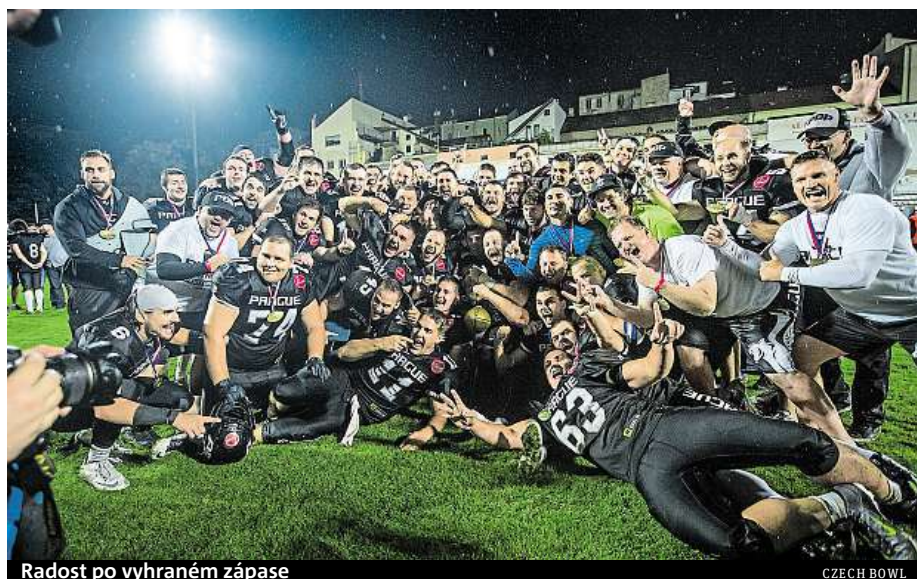
Radost po vyhraném zápase