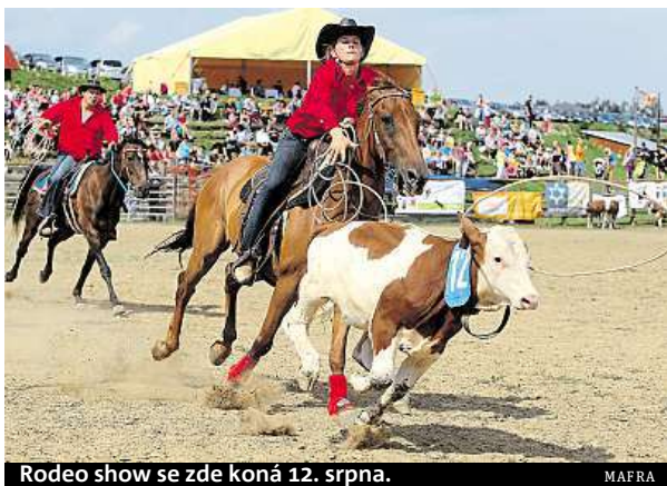
Rodeo show se zde koná 12. srpna.

A na ty, co se rádi bojí, se těší ve strašidelném zámku Draxmoor, který se nachází zhruba tři kilometry od westernového městečka. V zámku na návštěvníky mimo jiné čekají tři rozsáhlá patra se strašidelně-fantastickou expozicí, 3D kino, strašidelný výtah a zámecké nádvoří s po-