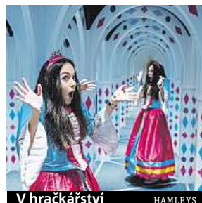
V hračkárství HAMLEYS