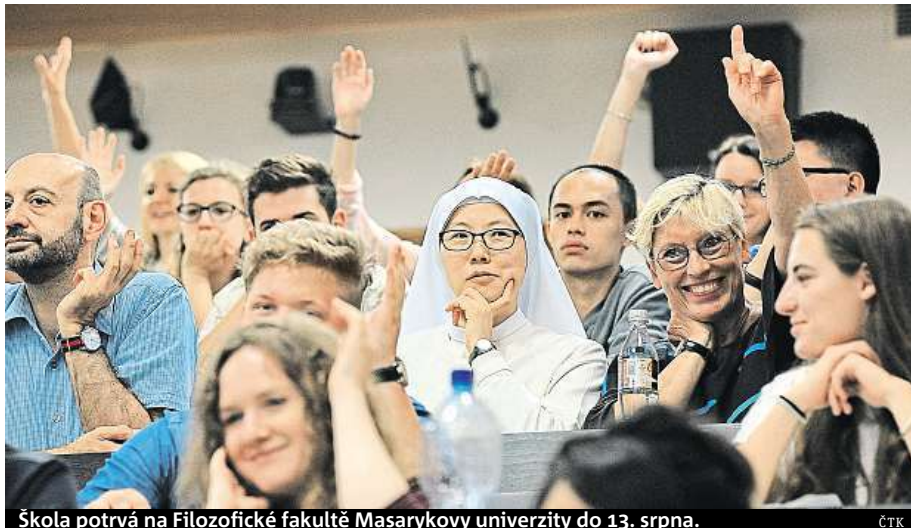
Škola potrvá na Filozofické fakultě Masarykovy univerzity do 13. srpna.