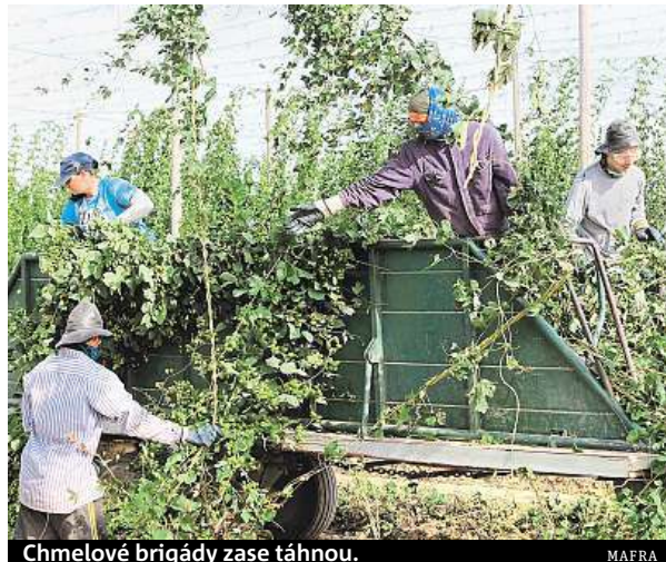
Chmelové brigády zase táhnou.

Boom chmelu v Česku odstartoval před pár lety díky zájmu minipivovarů. Těch bylo v lednu letošního roku evidováno celkem 302. Navíc i tradiční velké pivovary začínají měnit recepturu svých produktů a vaří čím dál více piva s větším obsahem chmelu, kterého se dožadují zákazníci, a o kvalitní český chmel je zájem i v zahraničí. Roste i celková produkce piva, která se zvýšila na 20,1 milionu hektolitřů, stejně jako export, jenž podle údajů Českého svazu pivovarů a sladoven vzrostl meziročně o více než třináct procent, na 4139 tisíc hektolitřů.