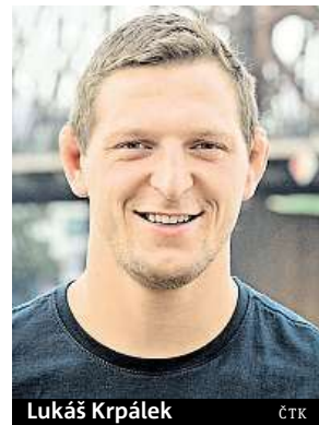
Lukáš Krpálek

Jako dvojnásobný mistr Evropy a mistr světa z roku 2014 bude v Riu patřit mezi favority kategorie do 100 kilogramů. „Chci tam podat maximální výkon. Obrovskou motivací je medaile, která mi jako jediná ještě chybí. Víím,