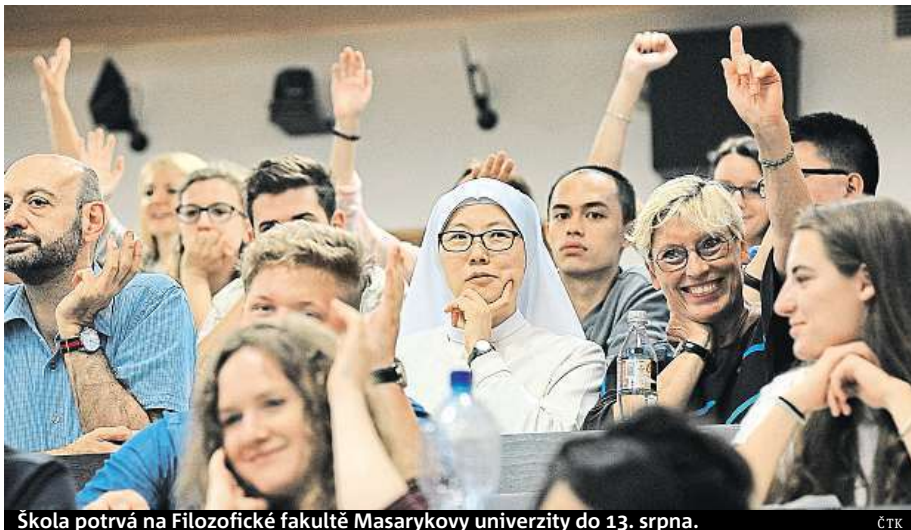
Škola potrvá na Filozofické fakultě Masarykovy univerzity do 13. srpna.