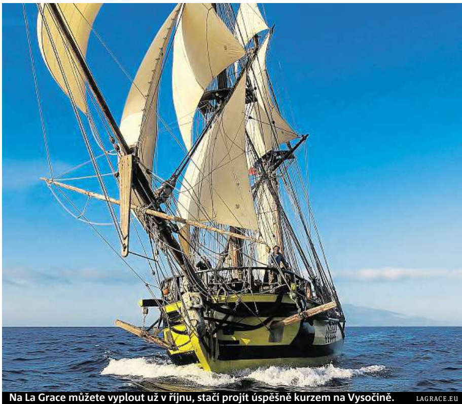
Na La Grace můžete vyplout už v říjnu, stačí projít úspěšně kurzem na Vysočině. LAGRACE.EU

„Hlavním cílem je poznat se za různých okolností. Budeme si trochu hrát, chceme vytvořit prostředí, ve kterém se projeví, kdo je týmový hráč, na koho se dá spolehnout a s kým byste na jedné lodi plout nechtěli,“ podotýká Žák. Na závěr víkendu proběhne velká volba, kdy budou moci všichni ovlivnit, kdo na loď pojede a kdo ne. „Plavba je součástí projektu,