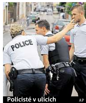
Policisté v ulicích

K útoku v Saint-Étienne-du-Rouvray se přihlásil Islámský stát. Jednoho z mužů, kteří v kostele zaútočili, sledovala policie delší dobu. Loni se snažil přes Turecko odcestovat do Sýrie a panovala obava, že měl napojení na teroristy. Muž byl podezřelý ze zločinného společenství a udržování vztahů s teroristickou organizací. Vyšetřován byl ale na svobodu a úra-