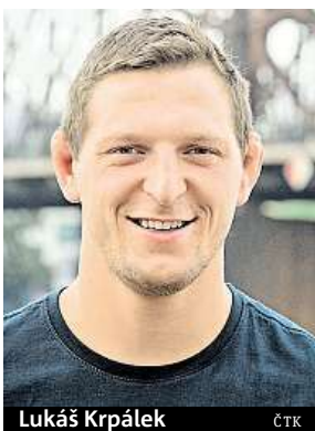
Lukáš Krpálek

Jako dvojnásobný mistr Evropy a mistr světa z roku 2014 bude v Riu patřit mezi favority kategorie do 100 kilogramů. „Chci tam podat maximální výkon. Obrovskou motivací je medaile, která mi jako jediná ještě chybí. Víím,