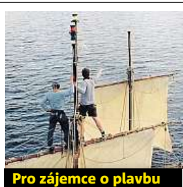
Pro zájemce o plavbu

Termín úvodního víkendu je 11. až 14. srpna, celou akci provázejí dobrovolníci.