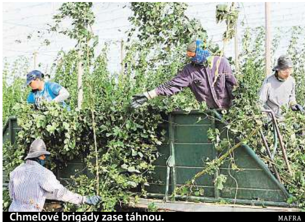
Chmelové brigády zase táhnou.

Boom chmelu v Česku odstartoval před pár lety díky zájmu minipivovarů. Těch bylo v lednu letošního roku evidováno celkem 302. Navíc i tradiční velké pivovary začínají měnit recepturu svých produktů a vaří čím dál více piva s větším obsahem chmelu, kterého se dožadují zákazníci, a o kvalitní český chmel je zájem i v zahraničí. Roste i celková produkce piva, která se zvýšila na 20,1 milionu hektolitřů, stejně jako export, jenž podle údajů České