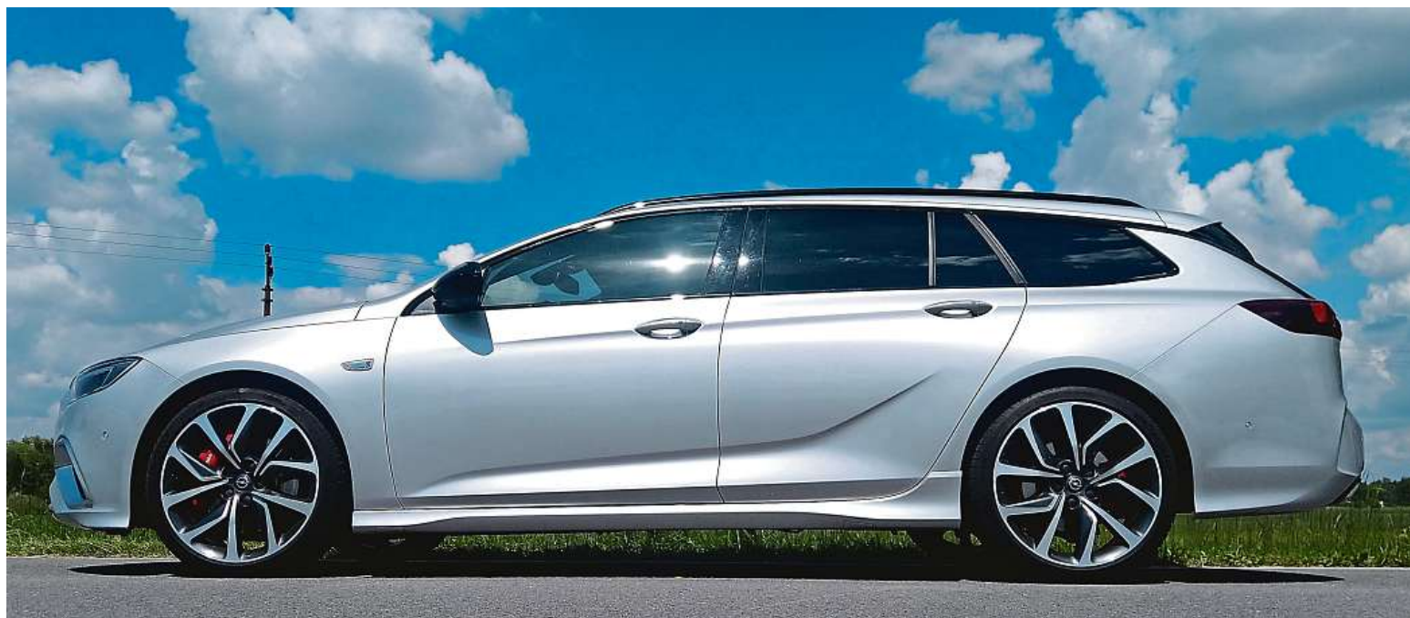
Na délku měří Opel Insignia 4986 mm. Podívejte se na tu ladnou siletu – a to koukáte na kombíka! Tohle se designérům povedlo.