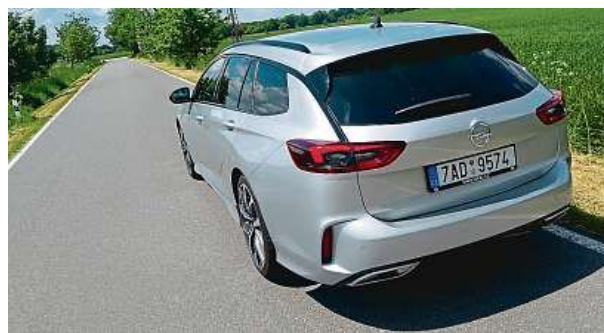
Spotřeba kufru je 560 litrů na jedno pořádné naložení...