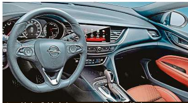
Interiér je přehledný a ergonomicky vyladěný.