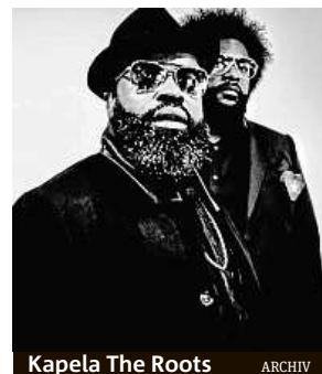
Kapela The Roots

Aktuální cena vstupenek je 99 eur. Více informací na www.pohodafestival.sk . MET