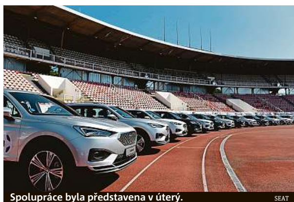
Spolupráce byla představena v úterý.