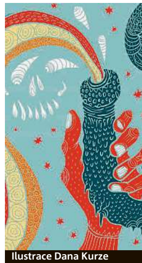
Ilustrace Dana Kurze

Obrazová stránka knihy Bohemian Taboo Stories vznik-