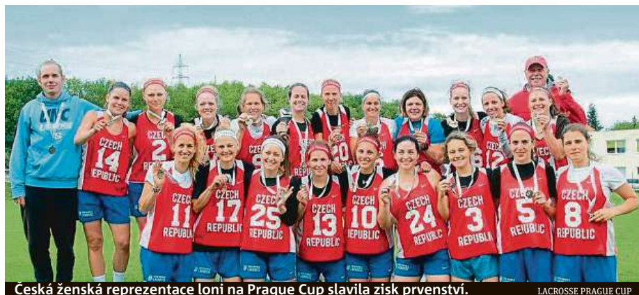
Česká ženská reprezentace loni na Prague Cup slavila zisk prvenství. LACROSSE PRAGUE CUP