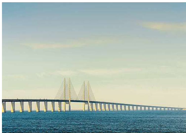
Øresundský most spojuje Dánsko a Švédsko.