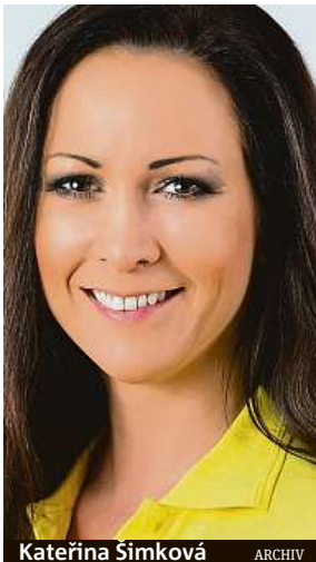
Kateřina Šimková ARCHIV

Česko zažívá tropický týden. Vedra v plné síle přišla včera. Na některých místech se podle meteorologů teploty šplhaly až na 37 stupňů. Do ulic českých měst musely vyjet kropicí vozy. Například Liberec pak zavedl novinku, „tregatory“ pomohou snášet vedra mladým stromkům uprostřed města. Dnes sice teploty spadnou, stále se ale budou držet na třiceti stupních. Ochlazení o další stupně přijde zítra a v sobotu, neděle bude opět tropická. Teploty od 34 do 37 stupňů představují velice vysokou zátěž pro lidský organismus, lidem hrozí přehřátí a dehydratace. Odborníci doporučují dodržovat pitný režim a omezit tělesnou zátěž v odpoledních hodinách. Dále je pak důležité nevystavovat děti ani zvířata přímému slunci. IDNES.cz