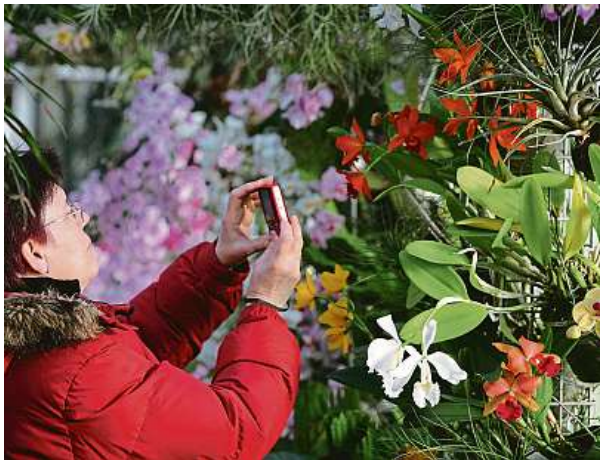
Jedním z objektů, kterých se spolupráce týká, je Botanická zahrada Mendelovy univerzity.