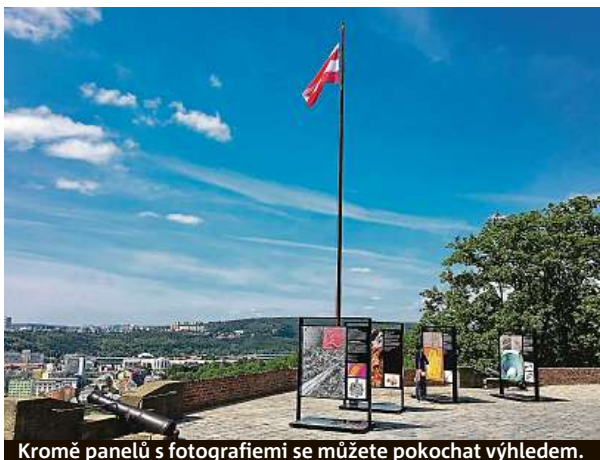
Kromě panelů s fotografiemi se můžete pokochat výhledem.

„Od zkoumání našich předmětů jsme neočekávali odhalení převratných informací, ale novou perspektivu, jak vnímat jejich historickou hodnotu. Když se díváte například na detail téměř dvě stě let starého medailonu, teprve si plně uvědomíte, jak precizní byla v tehdejších