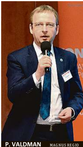
P. VALDMAN MAGNUS REGIO

Přestože na rozdíl od povodní není sucho pro většinu lidí na první pohled tolik patrné a například obyvatelé měst si ho neuvědomují, dokud jim teče voda z kohoutků, je to