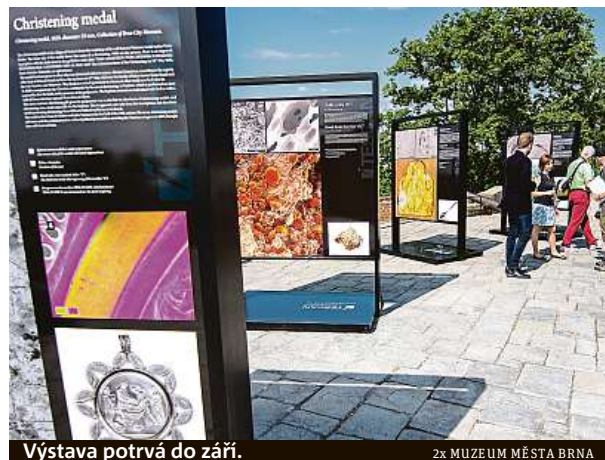
Výstava potrvá do září.

giemi výstava vzdává hold i Brnu jako světovému centru elektronové mikroskopie. Právě zde se vyrábí více než třetina světové produkce těchto přístrojů, které nachází uplatnění v medicíně, polovodičovém průmyslu nebo přírodních vědách.