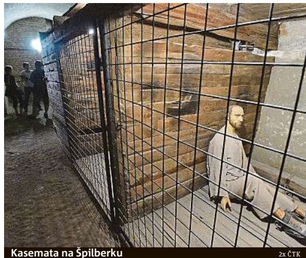
Kasemata na Špilberku

Na každém stanovišti se návštěvníci seznámí s jedním vězňem a jeho skutečným osudem. Podmínky v kasema-