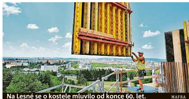
Na Lesné se o kostele mluvilo od konce 60. let.