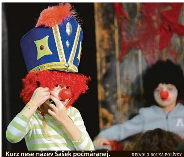
Kurz nese název Šašek počmáranej.