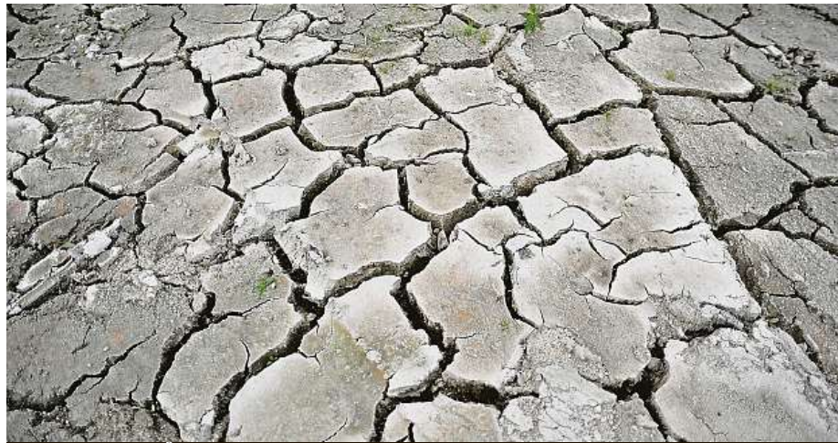
Sucho trápí celé Česko už několik let.

Dalším opatřením, které by mohlo přispět ke zlepšení situace, je propojení vodáren, jež by si v případě lokálního su-