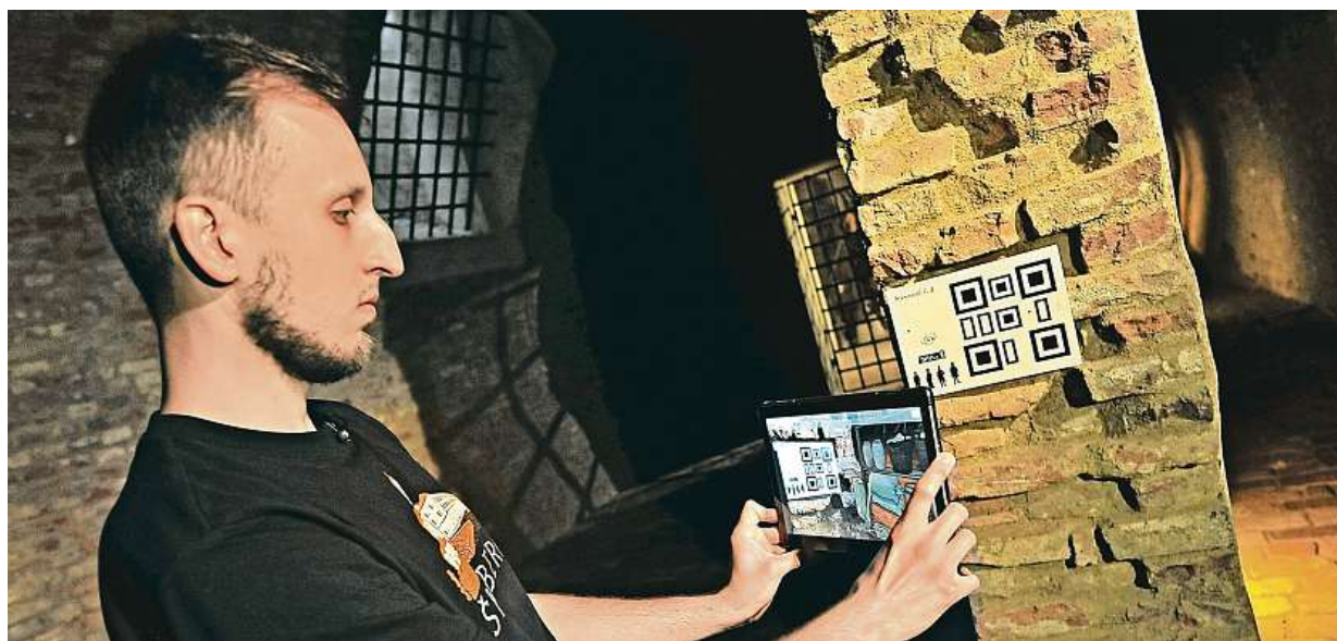
Muzeum města Brna představilo nový projekt Příběhy z kasemat pevnosti Špilberk. Více na straně 8.

Noví obyvatelé. Brno je chce přilákat novou strategií bydlení. Dvanáct let. Koncepce, kterou schválili zastupitelé, se dívá až do roku 2030. Byty. Nejenom pro mladé, ale i handicapované a chudší lidi STRANA 2