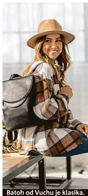
Batoh od Vuchu je klasika.

trhu, řekli si, co by nás bavilo, co by mohlo fungovat, a tak vznikla první série puntikátých peněženek Vuch. A ono to fungovalo a funguje dodnes, i když v úplně jiných relacích.