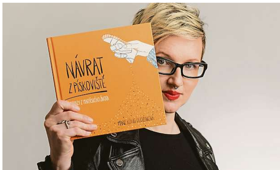
Ilustrovaná kniha popisuje situace ze života s malými dětmi.

Mám ještě pár měsíců, než se nám narodí druhé miminko, a chystám ilustrovanou knihu o tetování. Bude méně odborná než tři předchozí kni-