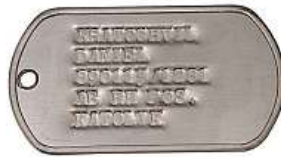
Hliníkový štítek ARCHIV

„Identifikační štítky mají být vyrobeny z hliníkové slitiny a mají mít podobu obdélníku se zakulacenými rohy, opatřeny mají být nápisem Ozbrojené síly Bělorus-