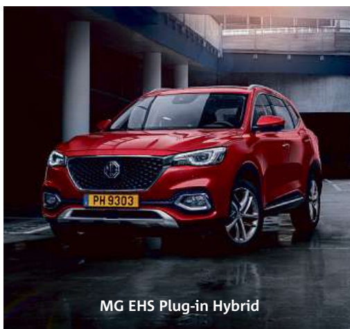
MG EHS Plug-in Hybrid