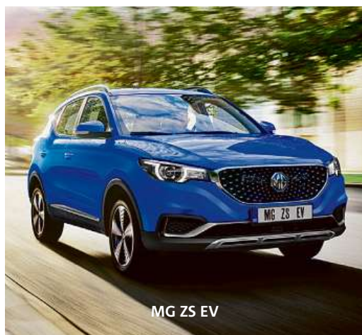
MG ZS EV

Známa britsko-čínská značka MG s téměř stoletou historií rozšiřuje své aktivity ve střední Evropě včetně Česka a Slovenska. Nabídne nám kompletní balíček prémiového designu, nejnovějších technologií a vysoké úrovně výbavy.