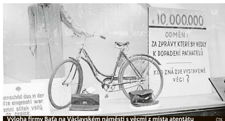
Výloha firmy Baťa na Václavském náměstí s věcmi z místa atentátu