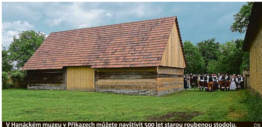
V Hanáckém muzeu v Příkazech můžete navštívit 500 let starou roubenou stodolu.

• O víkendu se uskuteční Slavnosti města Mikulova . Třídenní akce nabídne zábavu pro rodiny s dětmi. Obyvatelé