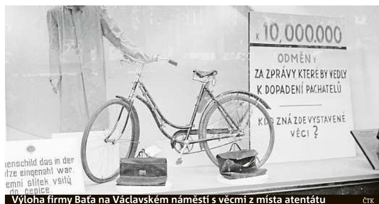
Výloha firmy Baťa na Václavském náměstí s věcmi z místa atentátu