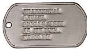
Hliníkový štítek ARCHIV

„Identifikační štítky mají být vyrobeny z hliníkové slitiny a mají mít podobu obdélníku se zakulacenými rohy, opatřeny mají být nápisem Ozbroyené síly Běloruska,