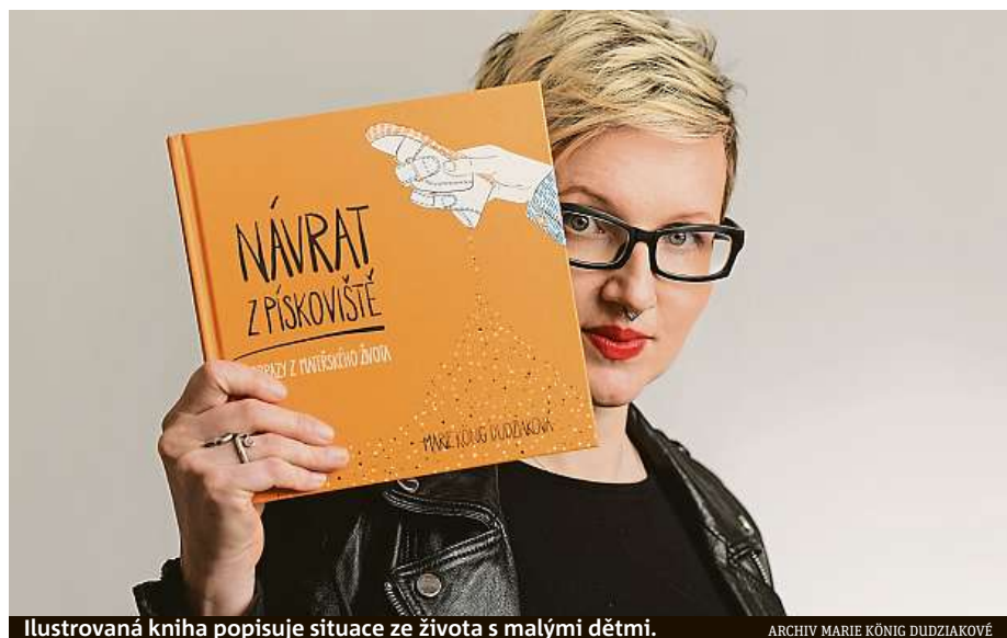
Ilustrovaná kniha popisuje situace ze života s malými dětmi.