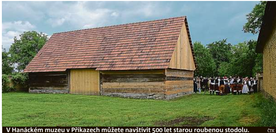
V Hanáckém muzeu v Příkazech můžete navštívit 500 let starou roubenou stodolu.

• O víkendu se uskuteční Slavnosti města Mikulova . Třídenní akce nabídne zábavu pro rodiny s dětmi. Obyvatelé města i jeho návštěvníci se