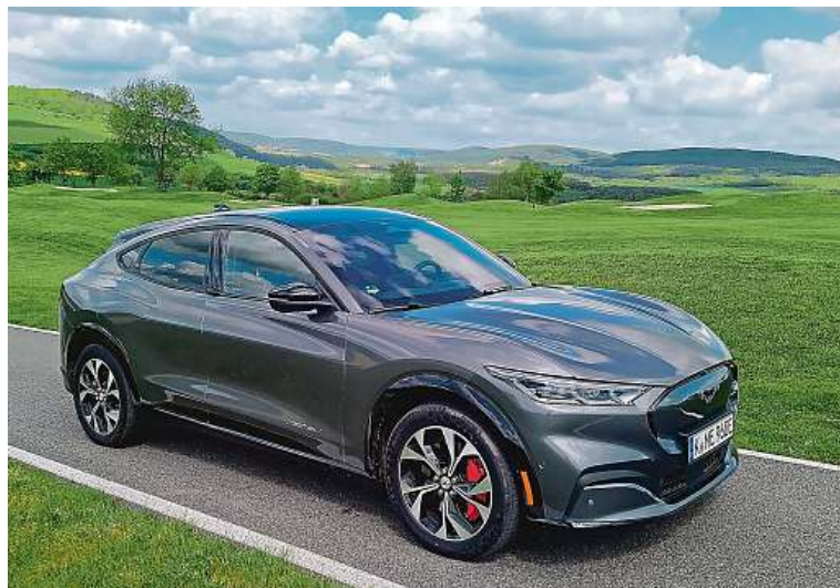
Auto přijde na trh na přelomu roku, cena startuje na 1,3 milionu korun.