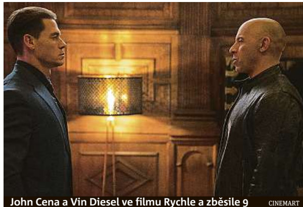
John Cena a Vin Diesel ve filmu Rychle a zběsile 9

Hned první den v pondělí v menších kinech, která