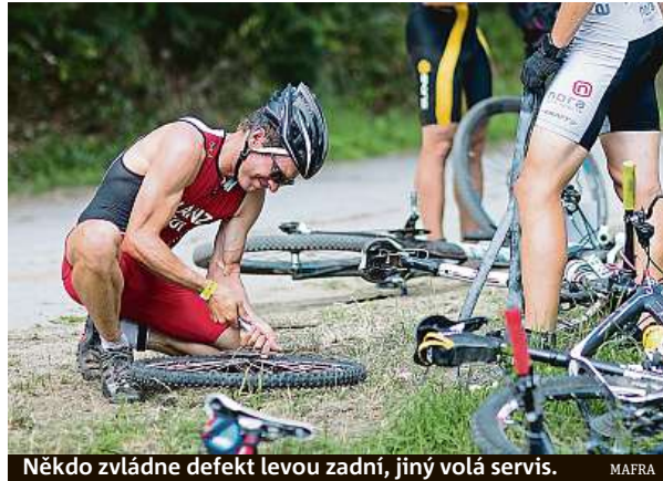
Někdo zvládne defekt levou zadní, jiný volá servis.

Čím dál tím dokonalejší stroje, přístroje, vybavení domácnosti, auta nebo věci pro sport a zábavu z nás dělají „nešikovné“ bytosti. Pro mnohé je však i zatlučení hřebíku problém.