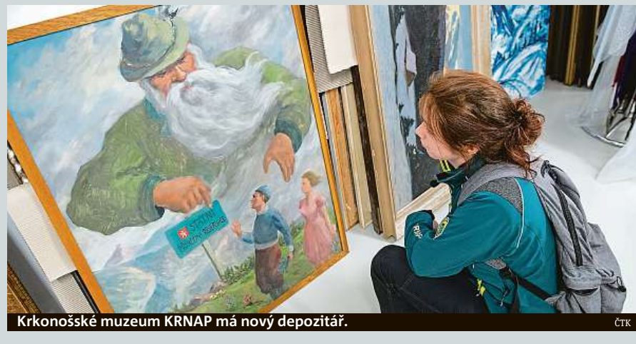
Krkonošské muzeum KRNAP má nový depozitář.

nů korun. Je v místě bývalého skladu Správy KRNAP v Hořejším Vrchlabí. Stávající budova byla rekonstruována a vzniklo nové konzervátorské a digitalizační pracoviště. Celé přízemí objektu je určeno k práci se sbírkami, v patře objektu je badatelna, zázemí pro kurátory jednotlivých podsbírek. Depozitář uchovává cenné doklady života v Krkonoších. ČTK