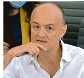
Dominic Cummings

Podle Cummingsa vládní ministři a premiér katastrofálním způsobem nedostáli standardům, jejichž dodržování od nich veřejnost měla právo očekávat v době nejnicivější globální pandemie za desítky let. Ostrě Cummings kritizoval především ministra zdravotnictví Matta Hancocka. „Myslím, že ministr zdravotnictví by měl být vyhozen kvůli nejméně 15, 20