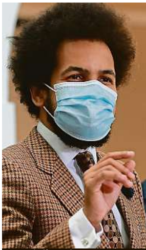
Dominik Feri

Feri v úterý oznámil rezignaci na poslanecký mandát poté, co ho několik žen v médiích obvinilo ze sexuálního obtěžování a násilí. „Prošetřování události provede pražské krajské ředitelství, konkrétně oddělení obecné kriminality Prahy 1,“ sdělila policie. Feri měl v říjnových sněmovních volbách figurovat