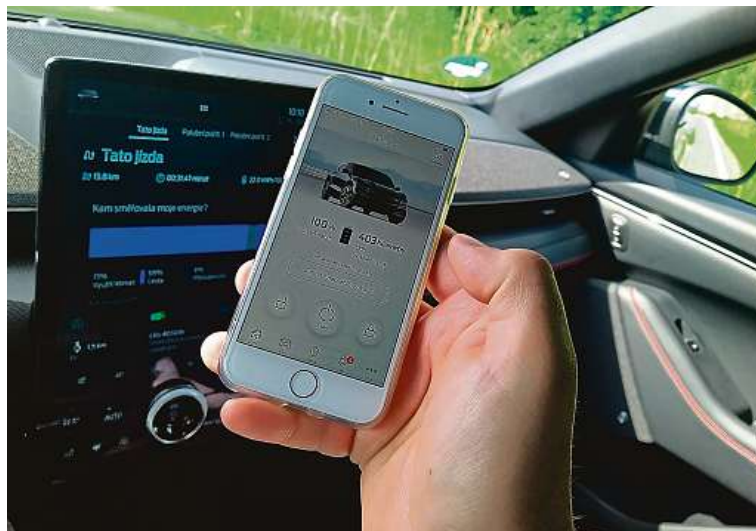
Takto vypadá mobilní aplikace v praxi, zjistíte skrze ni i dojezd.