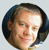
Daniel Hsv Jsou milí, hodní, přátelští. Díky za to, že tady jsou.